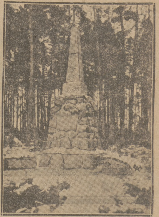
W kniei Dąbrowieckiej pod Łukowem odsłonięto pomnik ku czci ks. Stanisława Brzózki, jednego z ostatnich i najwytrwalszych wodzów powstańca styczniowego. Pomnik zbudowany został staraniem miejscowych organizacji i towarzysztw z okazji 70-jej rocznicy wybuchu powstania styczniowego.