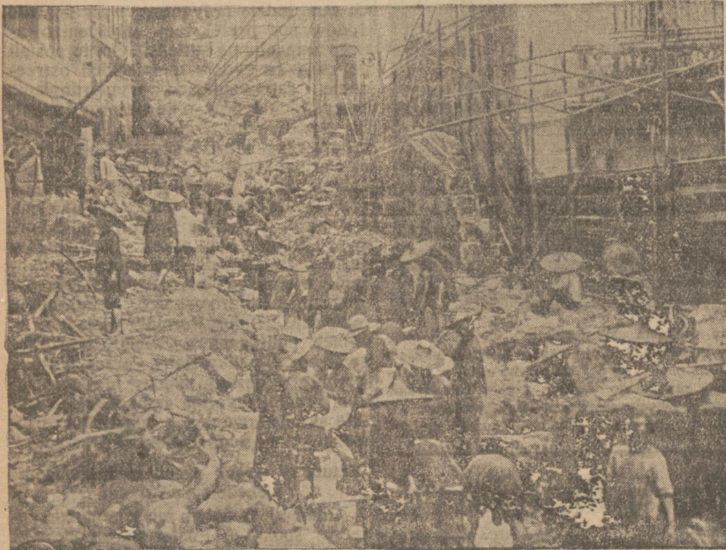
W Japonii żywo jeszcze w pamięci stoi wspomnienie wielkiego trzęsienia ziemi z przed paru lat, gdy znów kraj „Kwitnących Wiśni” nawiedzony został wstrząsami podziemnymi, które pociągnęły za sobą śmierć przeszło 500 osób, nie licząc paru tysięcy rannych. Zdjęcie nasze obrazuje nam prace z przed paru lat około oczyszczania ulicy z gruzów i zwalisk domów, zburzonych przez trzęsienie ziemi.

Wspomnienie ostatniego trzęsienia ziemi w Japonii.