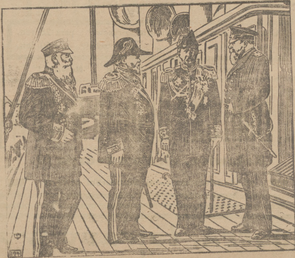
Admirałowie rosyjskiej floty bałtyckiej.

Ponieważ przy obecnym położeniu rzeczy i z powodu wymienionego zakazu Polacy katolicy największą na du-