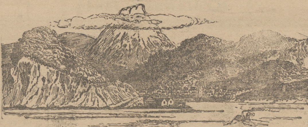
Port Petropawłowski na Kamczatce, dokąd rzekomo przedostać się pragnie admirał Roźdiestwieński.

W najnowszym wydaniu Newspaper Annual zamieszczono statystykę wszystkich pism, wychodzących w Stanach