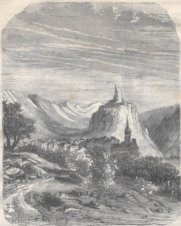
Le château de Vademorosa.

majorquine s'était gênée et resserrée pour faire place à vingt mille Espagnols que la guerre y avait refoulés, et que j'ai pu, sans erreur et sans prévention, trouver Palma moins habitable, et les Majorquins moins disposés à accueillir un nouveau surcroît d'étrangers qu'ils ne l'étaient sans doute deux ans auparavant. Mais j'aime mieux encourir le blâme d'un bienveillant rédacteur que d'écrire sous une autre impression que la mienne propre.