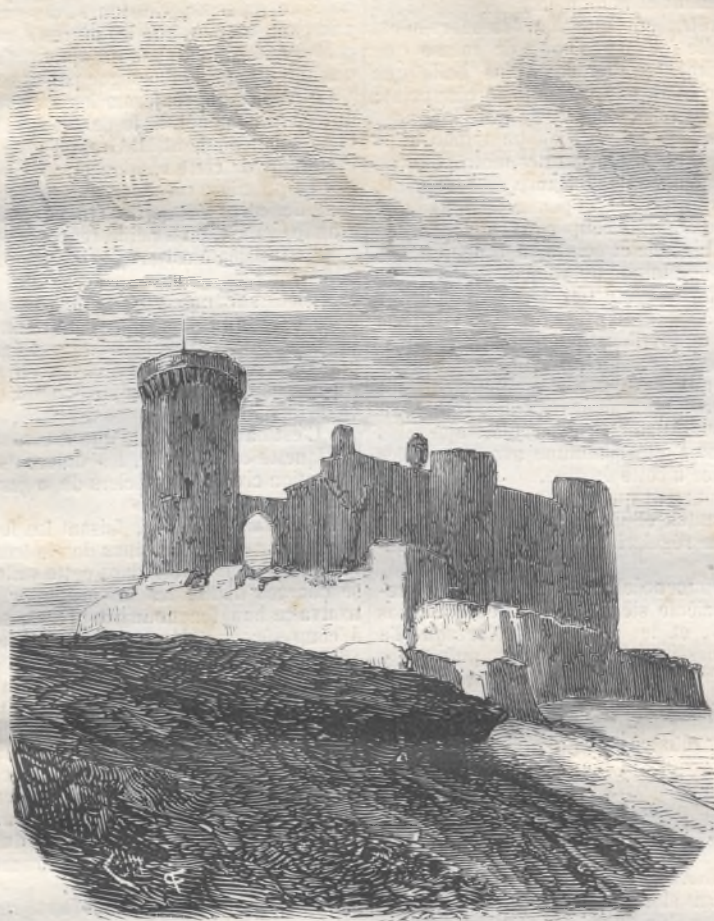
Le fort de Belver.

dont personne, à Majorque, ne m'a daigné signaler l'existence.