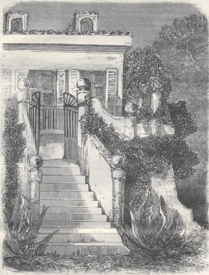
Son - Vent.

plaisir, après avoir senti les premières atteintes de l'hiver, de laisser l'ennemi derrière nous. A ce plaisir se joignit celui de parcourir une ville très-caractérisée, et qui possède plusieurs monuments de premier ordre comme beauté ou comme rareté.