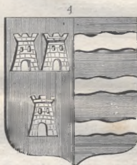
Armoiries. (Page 27.)

promenant dans le cloître des dominicains, je considérais avec douleur ces tristes peintures : un moine s'approcha de moi, et me fit remarquer parmi ces tableaux plusieurs marqués d'ossements en croix. — Ce sont, me dit-il, les portraits de ceux dont les cendres ont été exhumées et jetées au vent.