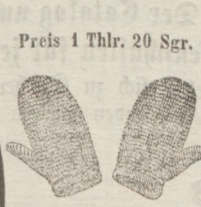
Haut-Handschuhe zum Bürsten jedes Körpertheils, den man mit der Hand bequem erreicht.