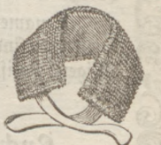
Haut-Reibeband zum Bürsten des Rückens bestimmt.

Diese Bürsten sind für einen Jeden, der sie kennt, unentbehrlich. Der Gebrauch geschieht auf ganz trockenem Wege ohne Bad oder Wasser; die Handschuhe sind für die mit der Hand erreichbaren Körpertheile bestimmt, das Band dagegen für den Rücken; sie gehören zur Ausstattung einer jeden Toilette und bieten dem Gesunden die höchste Annehmlichkeit, dem Leidenden dagegen eine große Erleichterung und Hilfe; man wendet sie in letzterem Falle hauptsächlich gegen kalte Füße, nervösen Kopfschmerz, Schlaflosigkeit, Jucken der Haut, Beklemmungen, Hexenschufs, Schlag-Anfälle, Starrkrampf, Rheumatismus, Ohrenreissen und rheumatischen Zahnschmerz u. a. m. mit sicherem Erfolge an. Bei Aufträgen von außerhalb erbittet man die Angabe, ob solche für Herren oder Damen bestimmt sind, und ob die Handschuhe für eine große oder kleine Hand passen sollen.