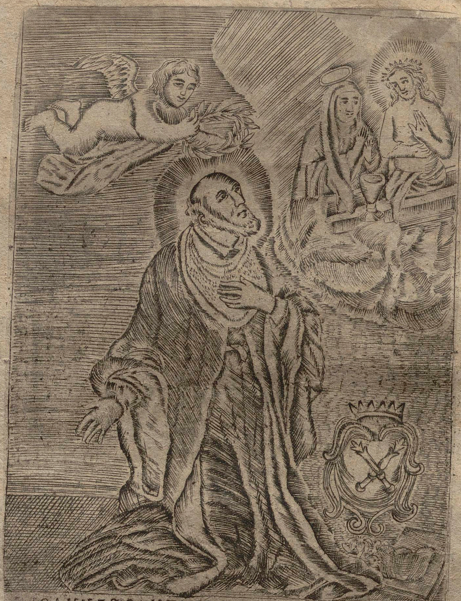
IOANNES CANTIUS Polonus S. Th. in Vniuersitate Cracouiensi Doctor Presbyter Secularis Romæ. A. D. 1688.

Non digitis gemmas, non longa monilia, collo, Sic auidè CANTI, Cracia Pallas amat; Vt potius cunctis his, TE non præferat VNVM, Majus & ex uno TE, sciat illa sibi Esse decus, nec compta foret sic pompa decori Gloria nec laudi, TE sine tanta Stoæ.