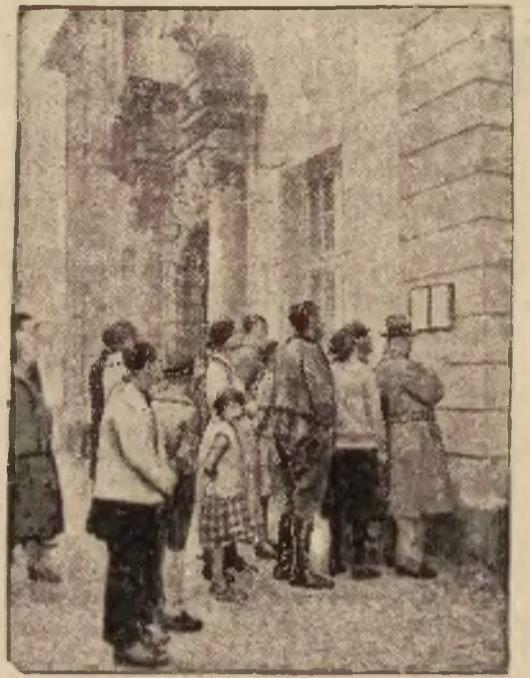
Rodziny nieszczęśliwych ofiar katastrofy w kopalni „Kurt“ przed gmachem zarządu kopalni w gorączkowym oczekiwaniu na komunikaty z przebiegu akcji ratowniczej.

Bo jeśli indjanie Meksyku wywołają się całkowicie, niewątpliwie i ich bracia w Ameryce środkowej pójdą w ich ślady. Już dziś przykład Meksyka działa na indjan wielu krajów w sposób bardzo właściwy. Odegra to pewną rolę i w polityce St. Zjednoczonych, które mocno ostygły ostatnio, jeśli mowa o pierwotnym planie „połknięcia“ Meksyku“, o którym myślnie zupełnie poważnie.