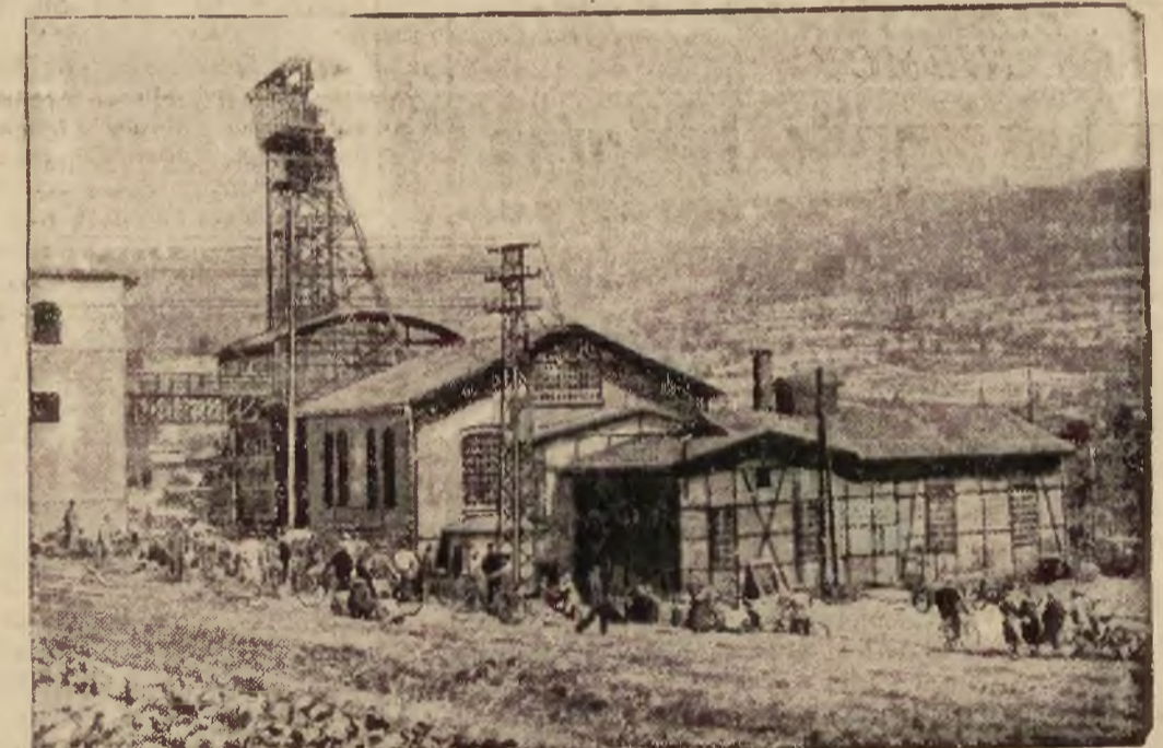
Ilustracja nasza przedstawia szyb kopalni, gdzie nastąpiła katastrofa. Jest to jedno z pierwszych zdjęć zaraz po katastrofie. Na pierwszym planie widać pierwszą zawieszoną na pomoc karetkę pogotowia.