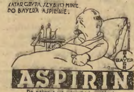
Do nabycia we wszystkich aptekach.