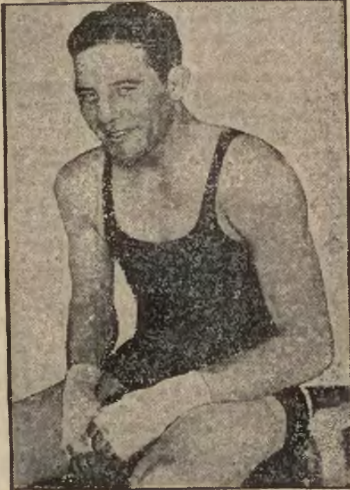
Mistrz świata Carnera (Włochy) na lewo i jego przeciwnik Baer (Stany Zjednoczone) mają stoczyć 14 czerwca w Nowym Jorku walkę, w której chodzi o tytuł mistrza świata na rok bieżący.

REDAKCJA: Warszawa, Nowy świat 22. Telefony 6.66.99 (sekretariat, dodatkowy red. naczelny); 6.66.62 (dział polityczny i ekonomiczny); 6.66.69 (dział miejski i liter.-art.); 6.66.59 (międzymiastowy). Sekretarz redakcji przyjmuje interesantów codziennie z wyjątkiem niedziel i świąt w godz. 11—12. ADMINISTRACJA: Warszawa, 7goda 1. Telefony: Administracja i Zarząd 691-64. Prenumerata 691-66. Wydział ogłoszeń 691-56. Skrzynka pocztowa 745. Adres telegraficzny — ABC Warszawa. Konto P. K. O. Nr. 13550. PRZEDSTAWICIELSTWA: Kalisz, Aleja Józefiny 11, tel. 209; Piotrków Trybunalski, Słowackiego 9, tel. 69; Włocławek, Cyganka 26, tel. 136. PRENUMERATA: miejscowa (z odnośnieniem do domu) i zamiejscowa — zł. 4.50 miesięcznie. Konto cke-kowe P. K. O. Nr. 13550.