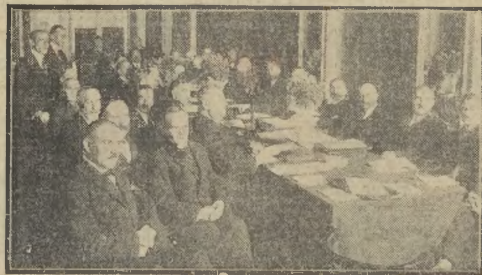
W tych czasach, kiedy reformie rolnej państwo musi poświęcić baczniejszą uwagę — zjazd Prezesów Okręgowych Urzędów Ziemskich nabiera szczególniejszego znaczenia.