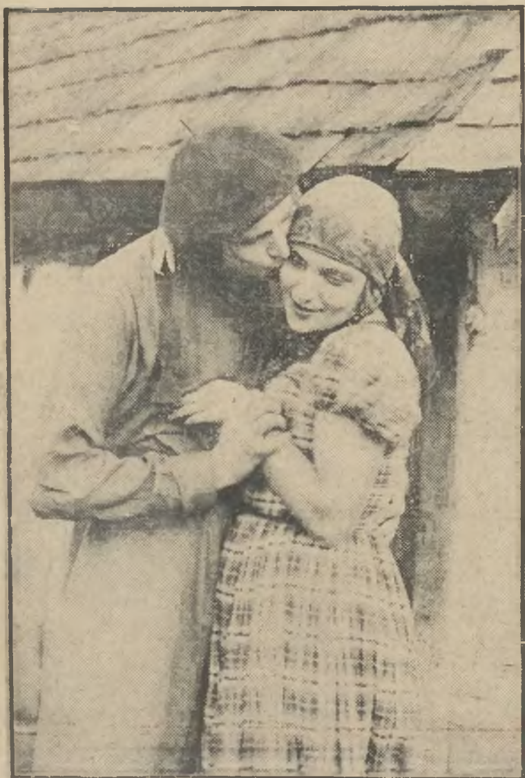
W polskim Hollywood w Kazimierzu nad Wisłą barwnie i żywo za-inscenizowano polski film „Szczęśliwy wisielec”.