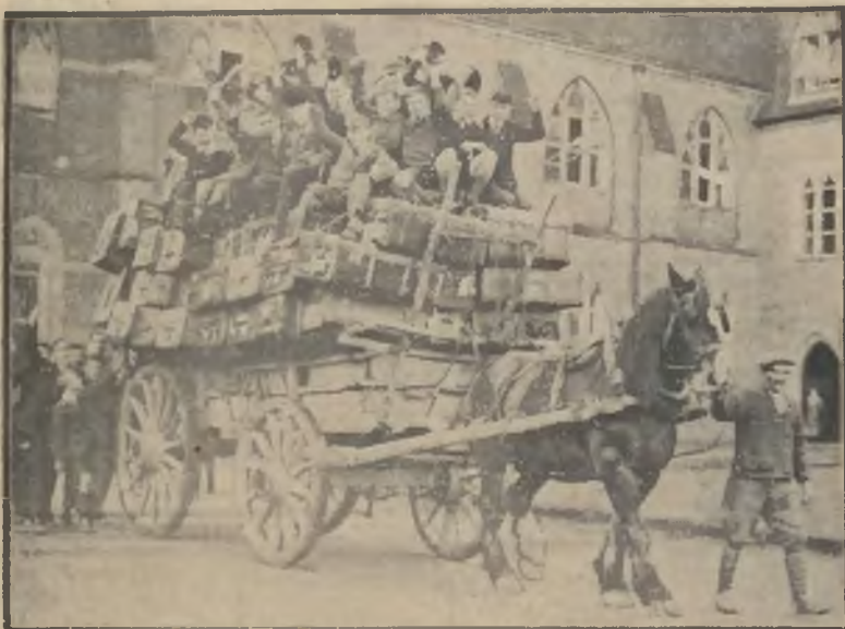
Z radosnym gwarem wyjeżdża się gromadą na świąteczne ferje; książki zostały w szkole.