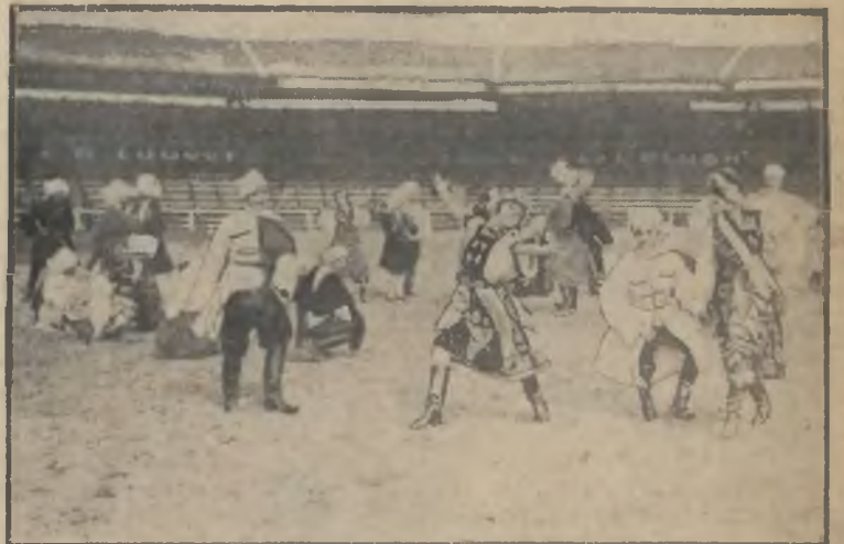
Emigranci rosyjscy rozrzucają dziś po całym świecie biorąc się do różnych sposobów zarobkowania.