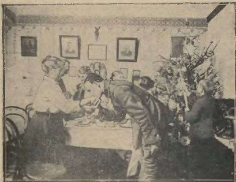
Jak błyskawica minął krótki urlop świąteczny. Czas żegnać dom i bliskich i wrócić do pułku.