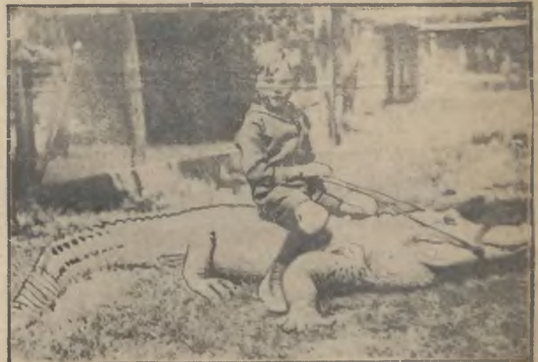
Pięcioletni synek kalifornijskiego farmera bawi się cały dzień tylko z aligatorami wychowanymi przez ojca.