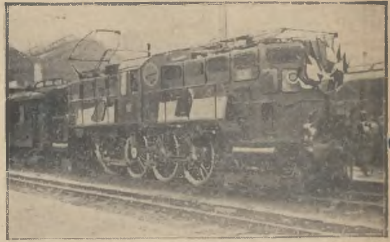
Pomiędzy Paryżem a Vierzon kursuje taki oto pociąg, ciągnięty przez elektryczną lokomotywę. Rozwija on znaczną szybkość od 100 — 130 km. na godzinę.