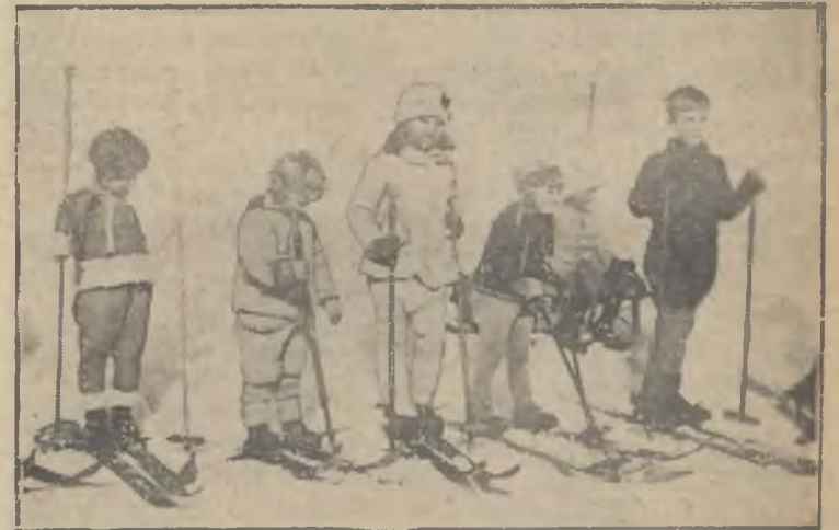
W Szwajcarii odbyły się ostatnio zawody narciarskie dla kilkuletnich dzieci. Zgłoszonych uczestników było bardzo wiele.