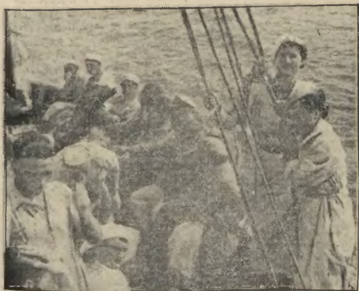
Uczestnicy obozów Ligi Morskiej na wycieczce na Bałtyku.