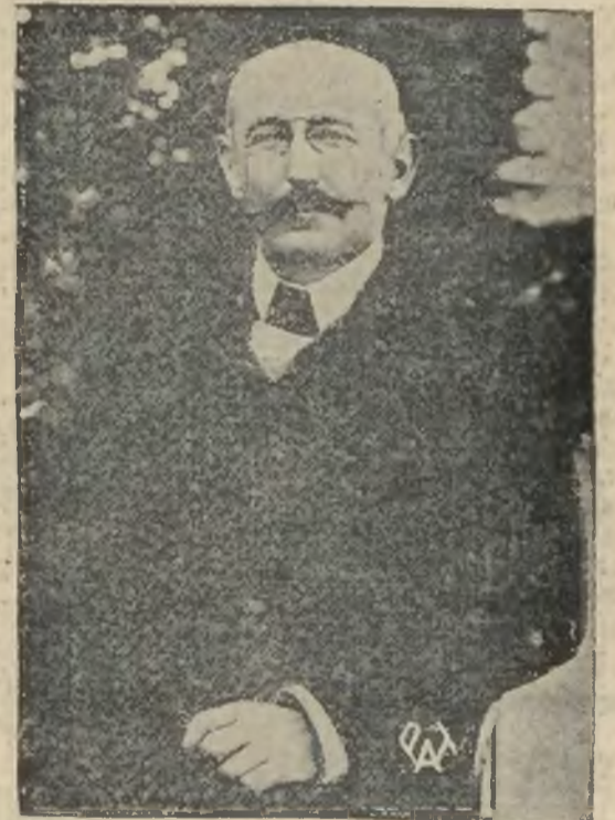
Pułk. Dreuftus, bohater procesu szpiegowskiego z przed 40 lat „uniewinniony i zrehabilitowany” zmarł w Paryżu.