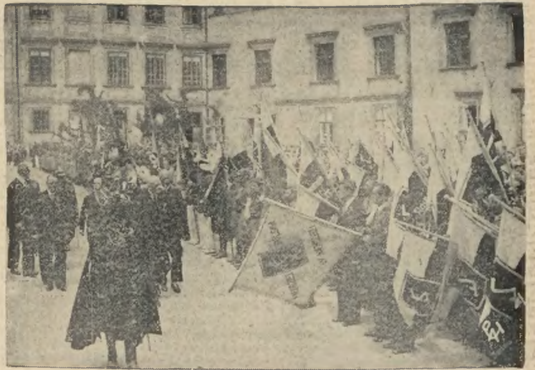
Delegacje młodzieży polskiej z Niemiec złożyły hołd Prezydentowi R. P. na dziedzińcu Zamkowym.