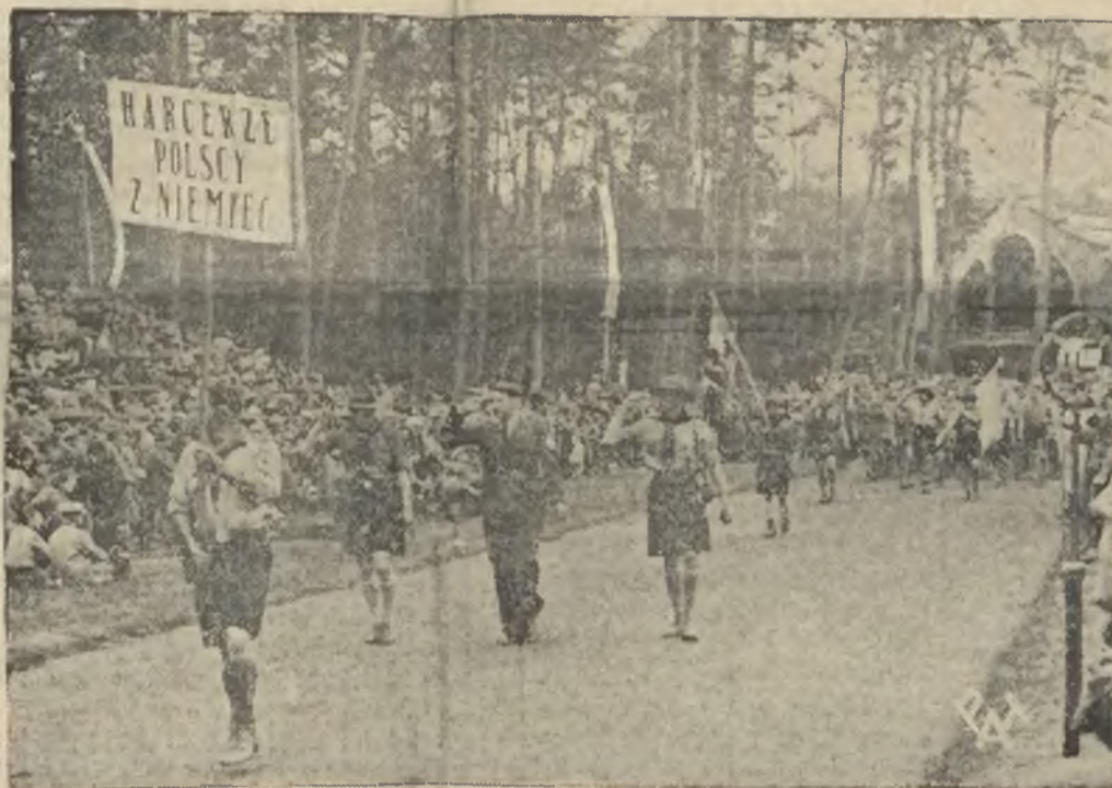
Ze święta harcerskiego. Defilada harcerzy polskich z Niemiec.