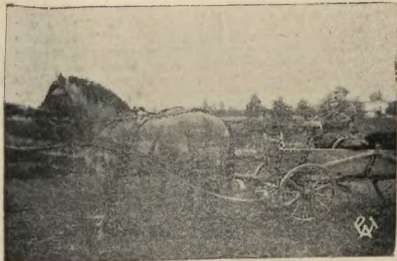
„Dzień konia” w Łowiczu. Gospodarz Szczyplński ze swoją parą koni, która zdobyła pierwszą nagrodę.