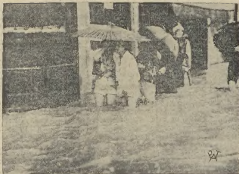
Powódź w Japonii. Ulica miasta Kioto zalana wodą.