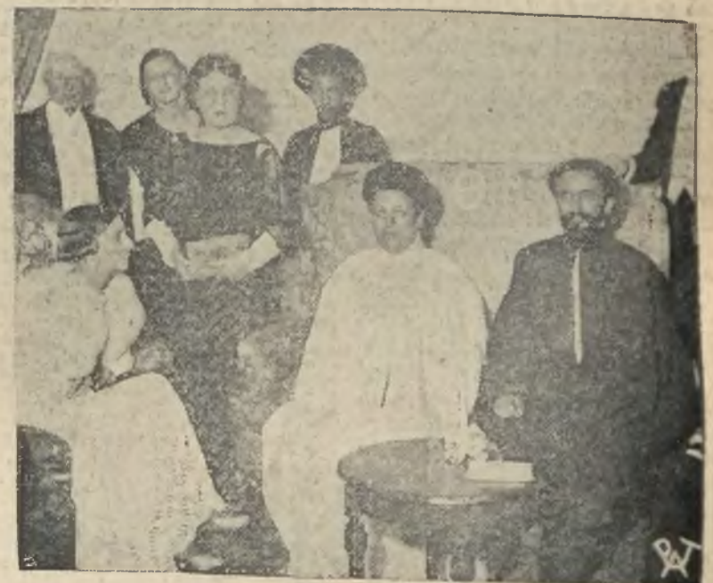
Przyjęcie dla dyplomacji na dworze cesarza Abisynji Haile Selassie.