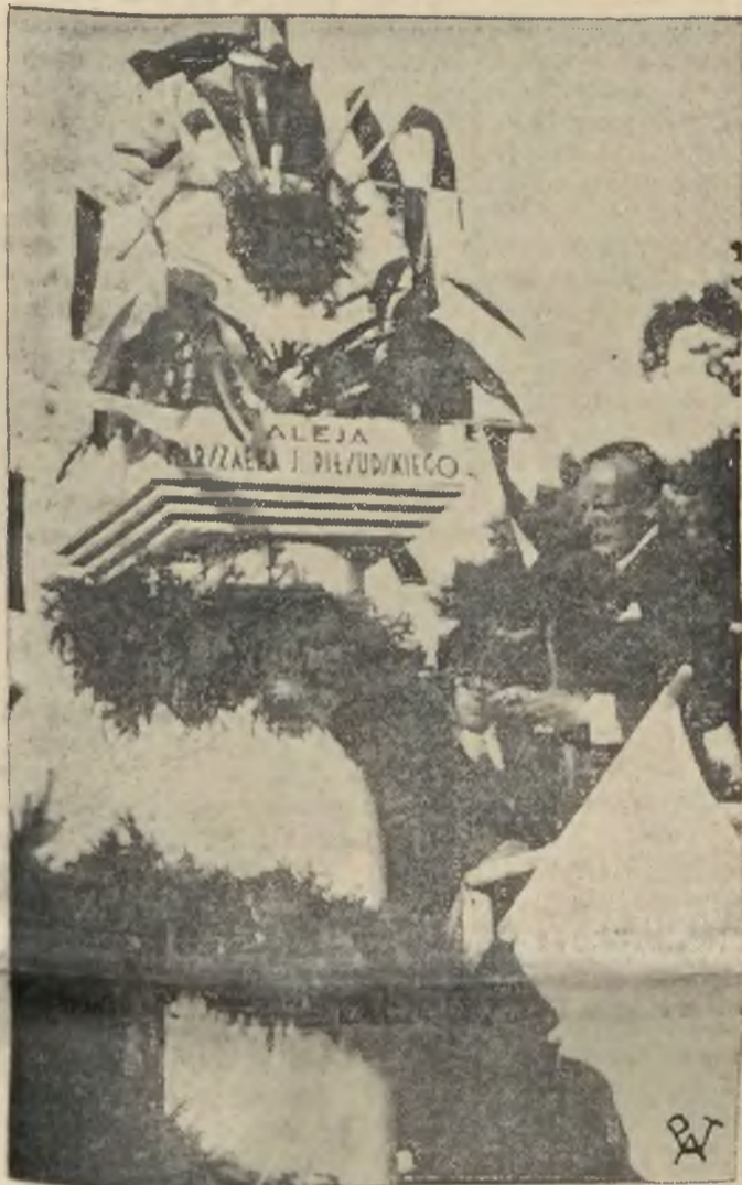
W Juracie na półwyspie Helskim odbyło się uroczyste przemianowanie drogi na Hel na aleję Marszałka Piłsudskiego.