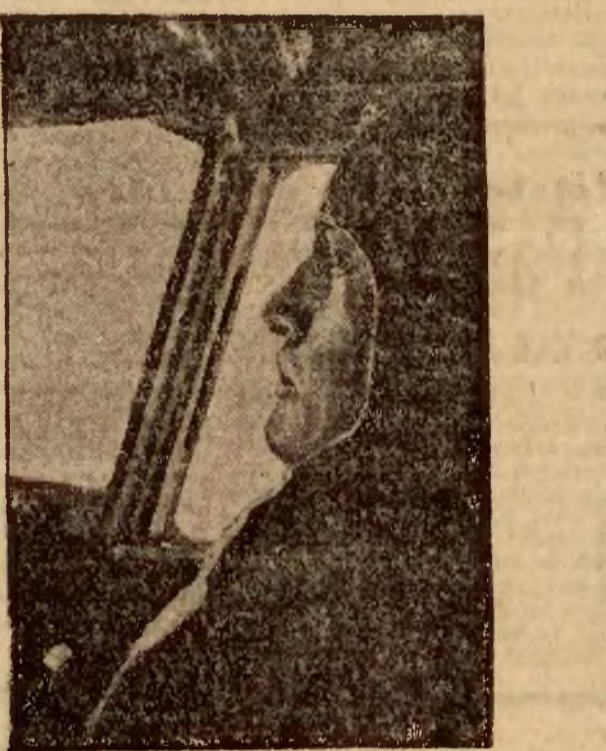
Mussolini otrzymał dyplom pilota wojskowego. Na lewo podajemy odbitkę dyplomu Mussoliniego, na prawo Mussolini podczas jednego z ćwiczebnych lotów.