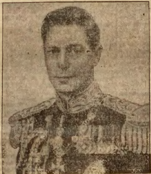
Król Jerzy VI.

Na str. 5-ej podajemy szczegółowy opis obrzędów koronacyjnych.