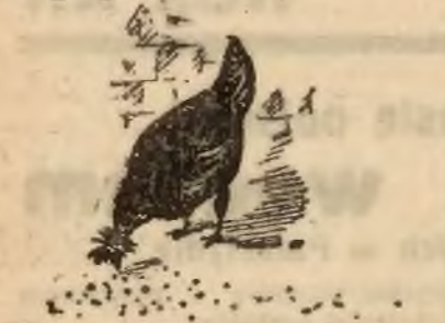
Ziarno do ziarna, a mierzka się zbiera. Z głosem wazak rosną kapitoły duże.

Czasz je pomnożył, to ci radzę szczerze Kuplos z LANGERA (znanej kolekturze)