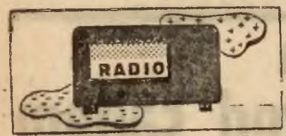
SOBOTA 12 czerwca

Warszawa, Marszałkowska 121, Otworzec Główny i Średniocowy, Wolska 13, Targowa 46, Poznań, Mielżyńskiego 21, Konto P. K. O. 1667