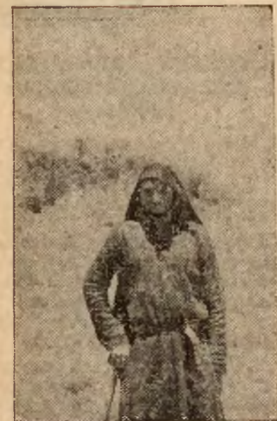
Arab z pustyni

Niestety, to jedna z niewielu wschodnich „oryginalności“, jakie do dziś dnia można jeszcze oglądać na „wybrzeżu bogów“. Arabowie z nad mo-