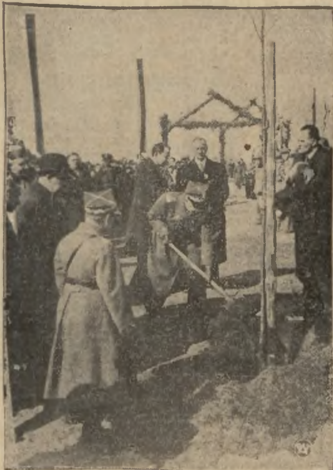
W ubiegłą niedzielę odbył się uroczysty obchód 105-tych rocznicy bitwy pod Grochowem. Na zdjęciu Generalny Inspektor Sił Zbrojnych, gen. Edward Rydz-Śmigły w czasie sadzenia pierwszej oliwy w alei Olszanki Grochowskiej.