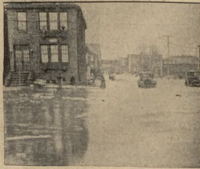
Miasto Mountain View zalane w czasie katastrofalnej wiosennej powodzi w Ameryce. Ogólne straty na terenie powodziowym przekroczyły 300 milj. dol.