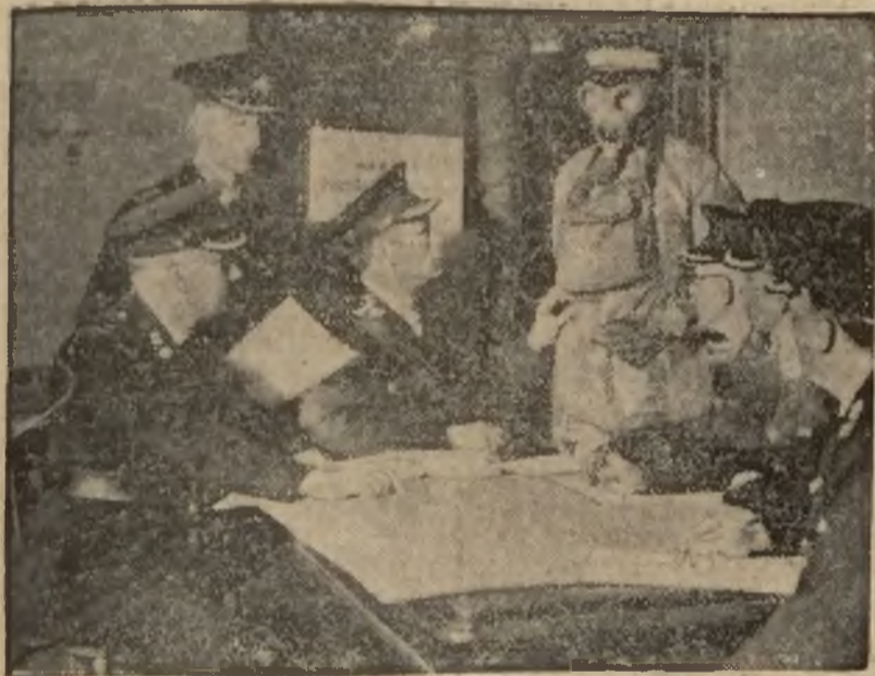
W Londynie powołano sztab obrony przeciwlotniczej. Na zdjęciu konferencja kierowników dzielnicowych sztabów obrony.