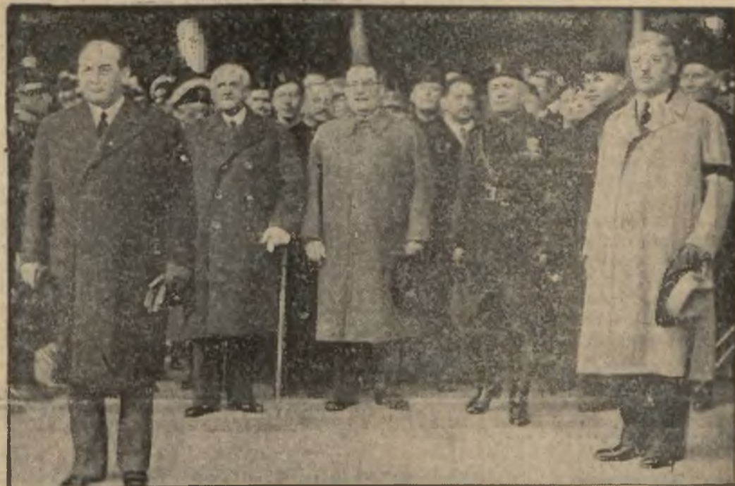
W Rzymie podpisano umowę polityczną i gospodarczą między Włochami, Austrią i Węgrami. Od lewej ku prawej stoją: Gömbös, Kánya (delegaci Węgier), Waldenegg (delegat Austrii), Mussolini oraz kanclerz Austrii Schuschnigg.