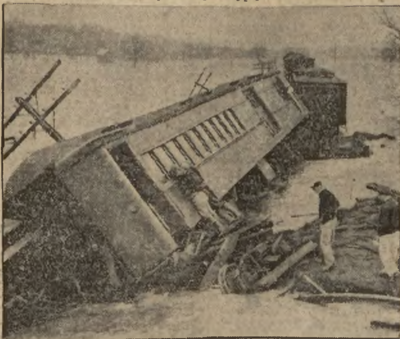
Wskutek powodzi, która zniszczyła tory kolejowe, nastąpiła straszna katastrofa pociągu pospiesznego w stanie New Jersey w Ameryce.