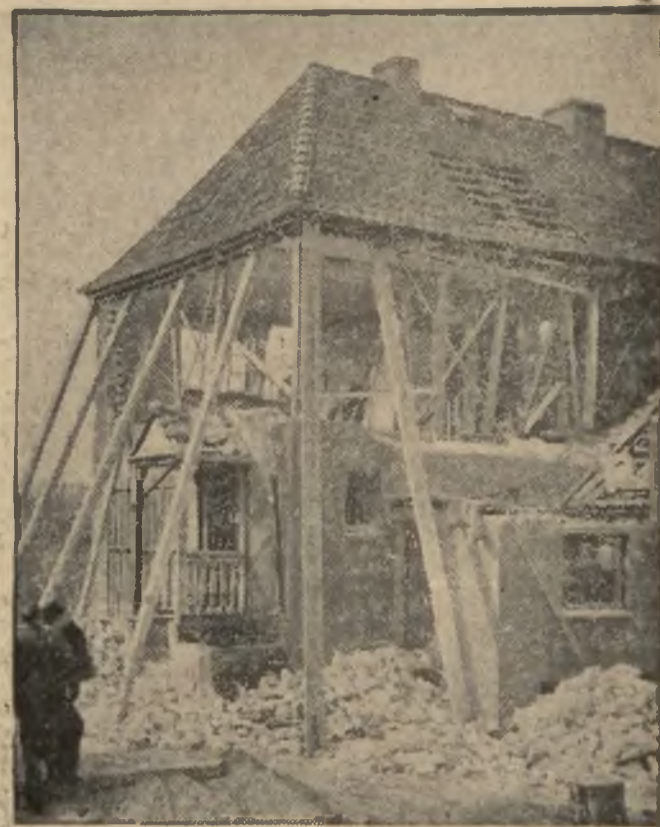
W miejscowości Süldorf pod Altoną nastąpił wybuch gazów, który zniszczył 2-piętrowy dom.