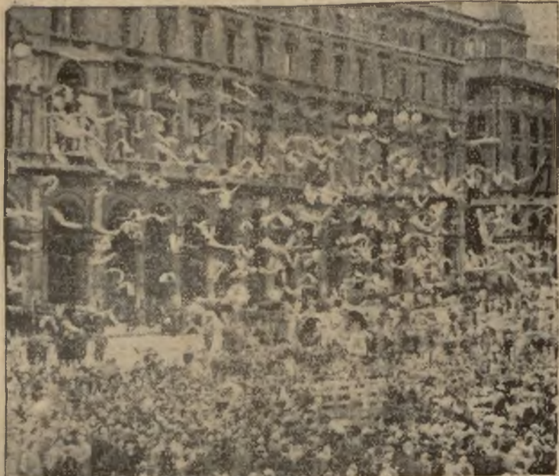
Gołębie pocztowe w ilości 1000, wypuszczone w Medjlanie, skąd zaniósł do Rzymu pozdrowienie obywateli Medjlanu z okazji rocznicy utworzenia partii faszystowskiej.