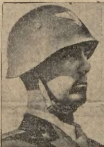
Następca tronu Włoch ks. Umberto, mianowany dowódcą korpusu neapolitańskiego.