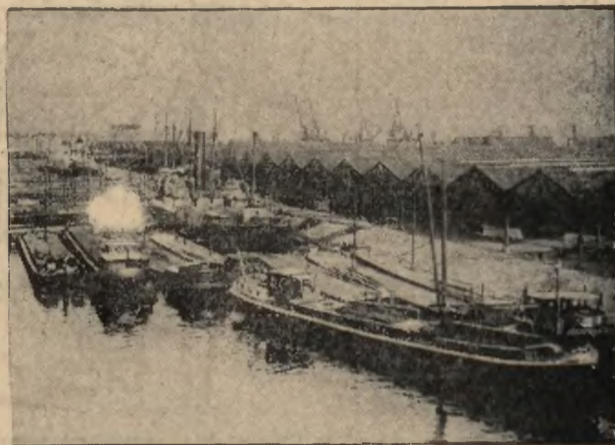
Robotnicy portowi w Antwerpij w liczbie 10.000, zastrajkowali. Wstrzymano wszystkie przeladunki w tym porcie.