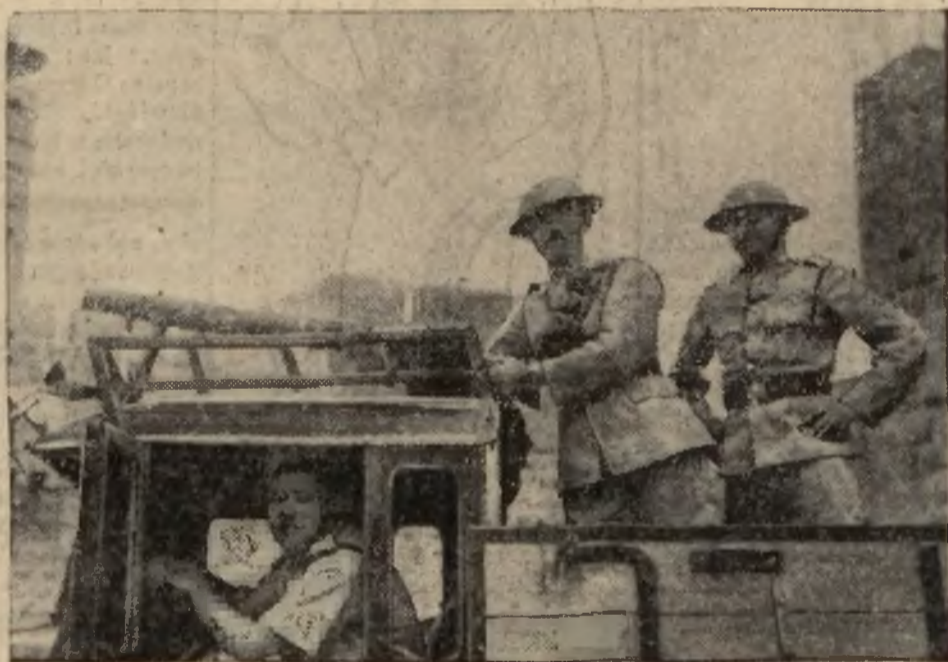
Wszystkie samochody ciężarowe zaopatrzone zostały w karabiny maszynowe oraz obsługę wojskową, w celu uchronienia się przed napadami Arabów.