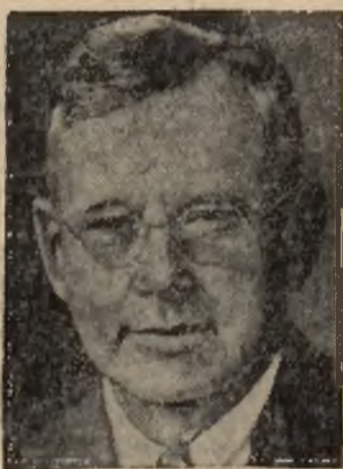
Alf Landon, wysunięty przez partję republikańską, jako kandydat na prezydenta Stanów Zjednoczonych.