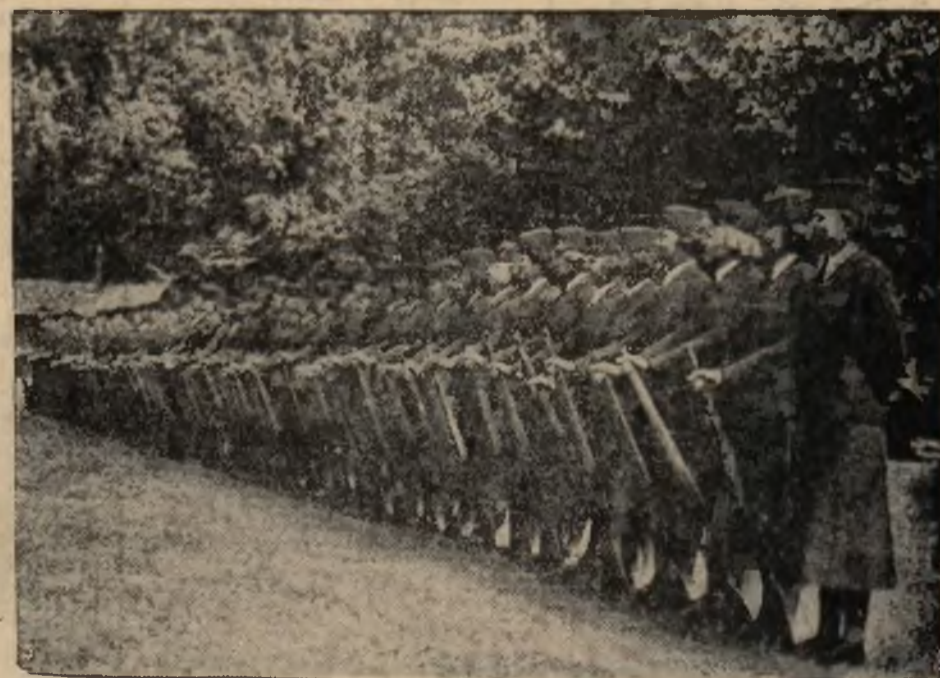
Oddział amerykańskich studentek z uniwersytetu w Ridal, ćwiczących się w strzelaniu.