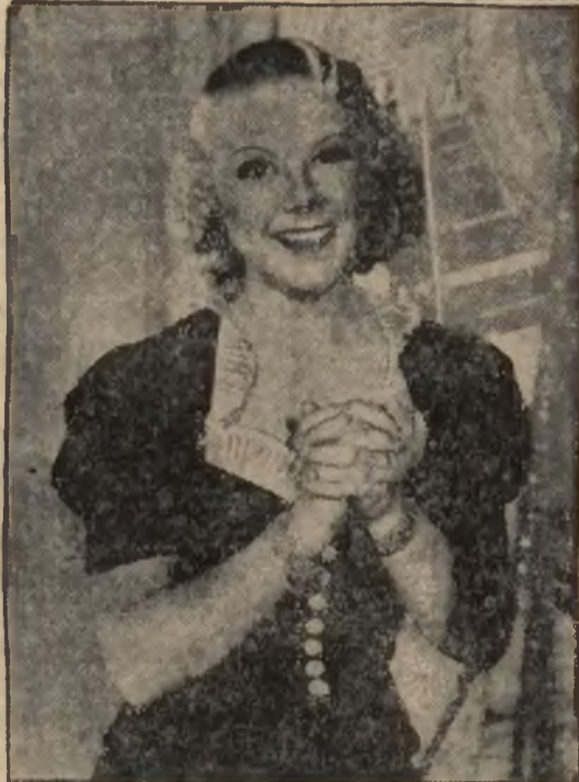
Słynna mistrzyni łyżwiarska Sonia Henje, została zaangażowana przez jedną z wytwórni filmowych w Ameryce i wystąpi na ekranie.