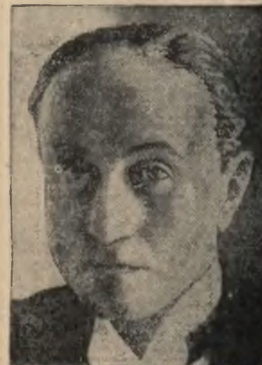
Sir Samuel Hoare, b. angielski min. spr. zagr., mianowany pierwszym lordem admiralicji