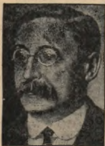
Nowy premier francuski, Leon Blum.