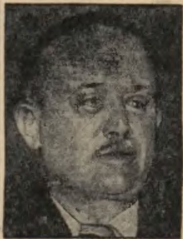
Minister skarbu Vincent Auriol.