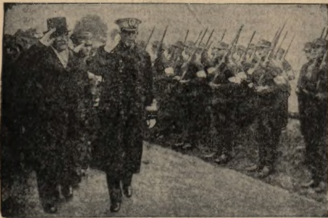
Król Szwecji, Gustaw, złożył wizytę prezydentowi Finlandji, Svinhufvudowi.