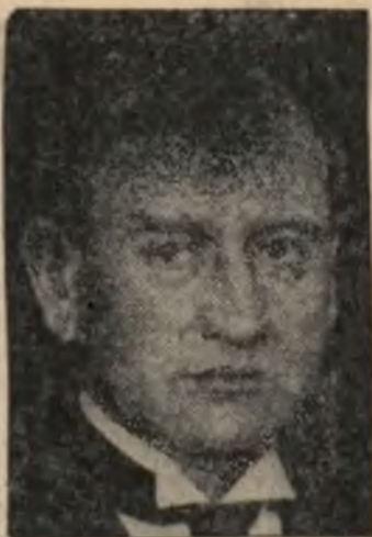
Minister obrony narodowej i spr. wojskowych, Edward Daladier.