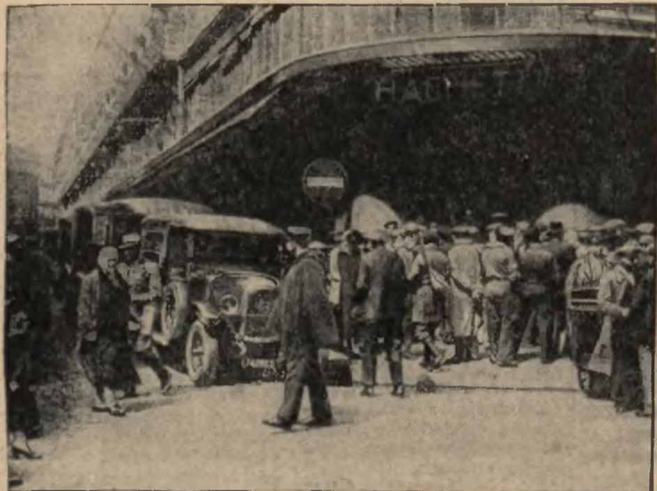
Strajk w Paryżu objął również szoferów i obsługę organizacji sprzedaży dzienników. Na zdjęciu strajkujący robotnicy przed firmą „Hachette“.