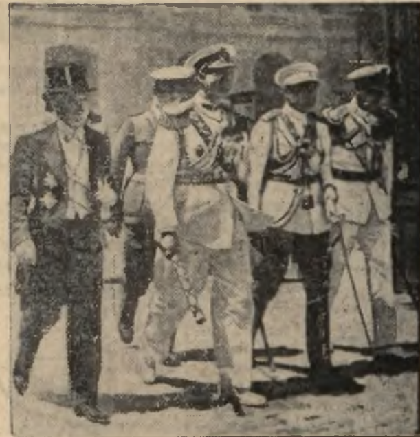
W Bukareszcie odbyło się spotkanie prezydenta Czechosłowacji Benesa oraz regenta Jugosławii księcia Pawła z królem Rumunii, Karolem II-gim.