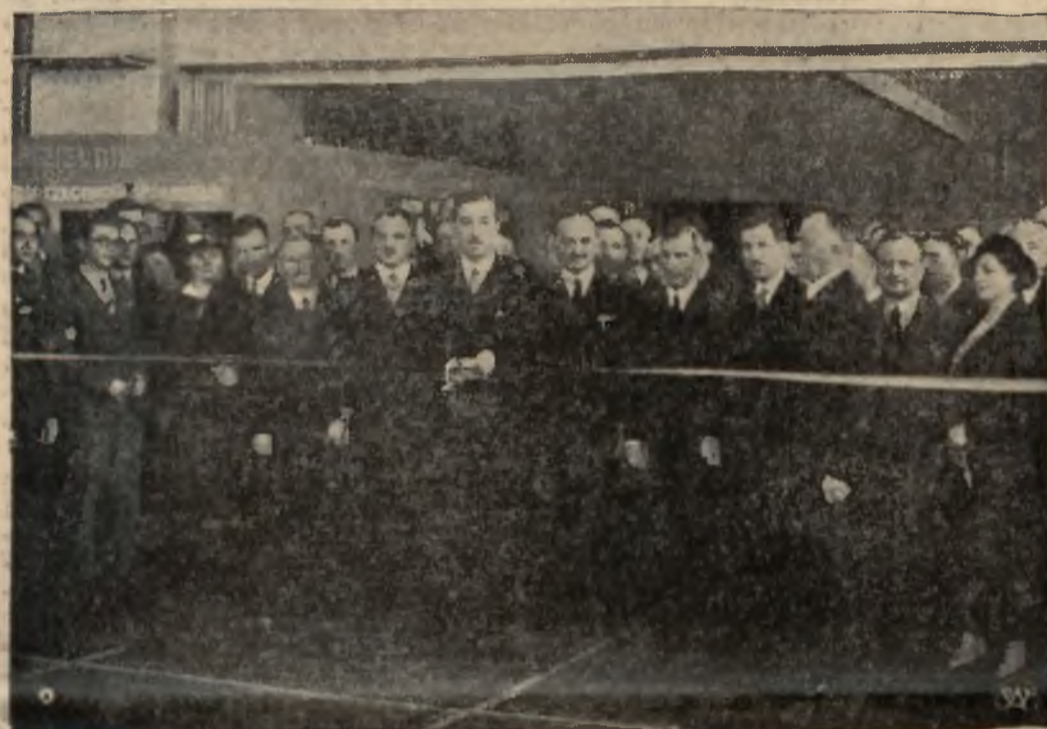
Wicepremier Kwiatkowski dokonał otwarcia jubileuszowej wystawy spółdzielczej „Spółem“, przy udziale członków rządu.