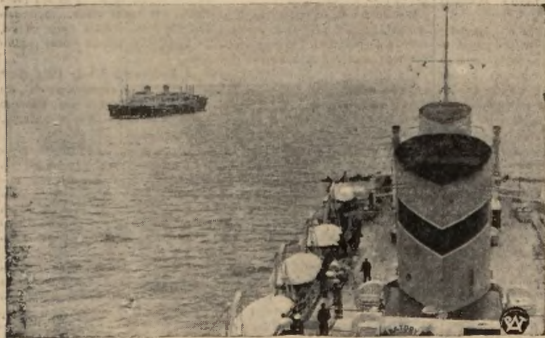
Na pełnym oceanie nastąpiło spotkanie dwu nowych statków polskich „Piłsudski“ i „Batory“, z których jeden wracał z Ameryki, drugi zaś udawał się w podróż inauguracyjną.