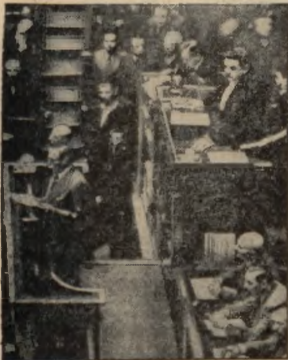
Nowy premier francuski Leon Blum, przemawia na posiedzeniu parlamentu. Na prawo widać prezydenta parlamentu, Herriot'a.