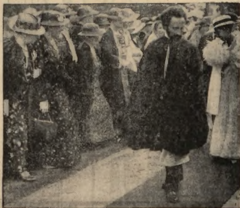
Negus Abisynji, Haile Selassie, wydał w ogrodzie swego domu w Londynie przyjęcie, w którym wzięły udział liczne przedstawicielki arystokracji angielskiej.