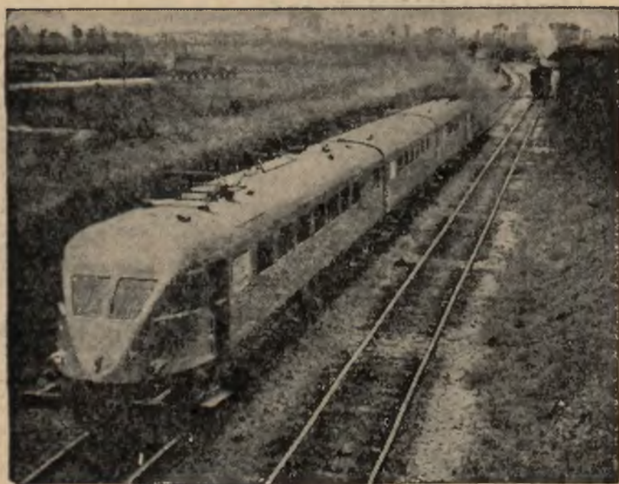
Na linii kolejowej Medjolan — Bolonia, uruchomiono pociąg „blyskawicę“, rozwijający szybkość do 200 km. na godzinę.