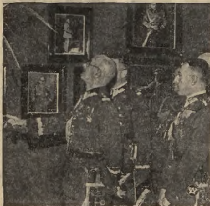
Generalny Inspektor Sił Zbrojnych gen. Rydz-Śmigły, zwiedził wystawę p. n. „Najlepsza fotografia Marszałka Józefa Piłsudskiego“.

OTWARCIE WYSTAWY SPÓLDZIELCZEJ W WARSZAWIE