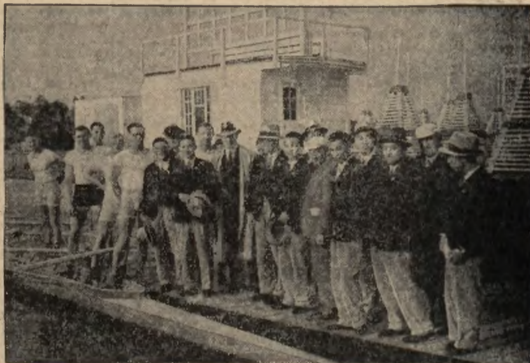
Ekipa japońskich wioślarzy, która weźmie udział w olimpijskich regatach w Grünau, przybyła już do Niemiec.