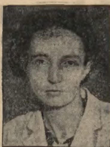
Podsekretarz stanu dla badań naukowych, pani Joliot-Curie.