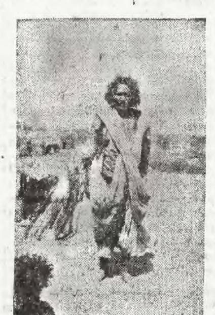
Koczownik Biszari z Asuanu

Każdy Beduin uważa się za coś nieskończenie wyższego od egipskiego Fellaha. Nigdy też nie wstąpiłby w związki małżeńskie z Fellaszka. Groziłaby mu zresztą za to zemsta ze strony współplemieńców: krew arabska nie może ulec zanieczyszczeniu. Tak samo źle byłoby z dziewczyną, którąby chciała poślubić Egipcjanina — własny brat lub ojciec zamordowałby ją bez litości. Podobny wypadek miał miejsce przed kilku miesiącami. Tak samo śmierć z ręki najbliższych czeka kobietę, czy dziewczynę