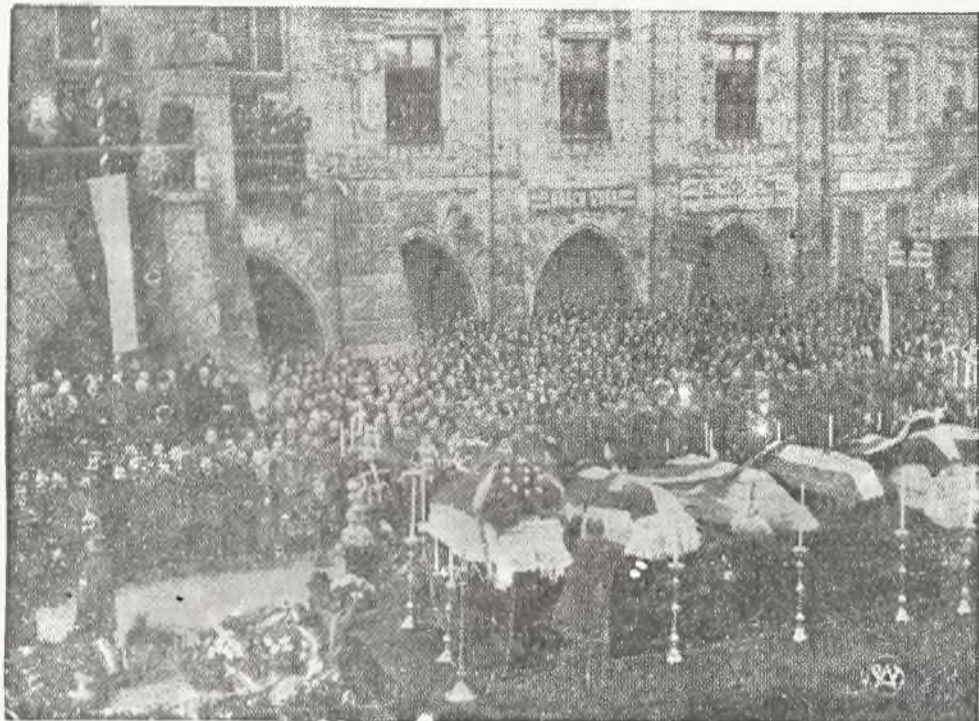
Pogrzeb żołnierzy węgierskich, poległych podczas natarcia wojsk czeskich i oddziałów rządu Wołoszyna na Munkacz.