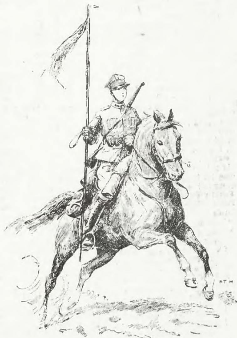
Wdzięczna pamięć Polaków składa im hołd, poezja sławi ich czołwy. Biblioteki całe zawierają opisy tych „przewag“, a w nich ma swoje miejsce piękna „Księga jazdy polskiej“.

Po długim okresie niewoli, kiedy koń, szabla i mundur ulanski były tylko symbolami marzeń, nadszedł wreszcie dzień, kiedy jazda polska porwała się znów do ataku. Rozbłysła znów błyskawica szabel. Tym razem niosły one wolność ojczyźnie. Świeże, niedawne wspomnienia. Ziemia pobożni: Rokitny, Krechowiec, Komarowa, Korostenia, Jazłowiec nie spoieliła jeszcze kości poległych ulanów. A poległo ich wielu. 4052 ulanów i 140 artylerzystów konnych usiało swymi ciałami drogę do wolności. O wielkości ich czynów mówią krzyże „Virtuti Militari“ błyszczące na pięciu sztandarach pułków ulan- skich. na czterech proporcach trąbek dywizjonów artylerii konnej, na 1543 piersiach ulanów i 188 artylerzystów konnych.