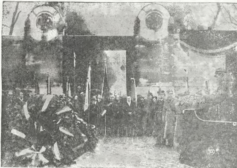
Fragment uroczystości na cmentarzu Père Lachaise w Paryżu, w związku z ekshumacją zwłok gen. Tadeusza Tyszkiewicza, żołnierza kościuszkowskiego, oficera sztabu generalnego Napoleona. Przewiezienie zwłok generała do Polski jest dopełnieniem jego ostatniej woli, którą nakazywał rodzinie pochowanie go w ziemi ojczyściej, nie przed jej odzyskaniem, aż ta odzyska wolność.