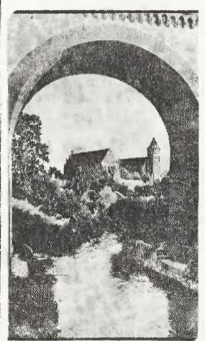
Widok na zamek w Olsztynie

Obecnie największym lasem tutaj jest Puszcza Jansborska, zajmująca 1 tys. km. kw. prze-