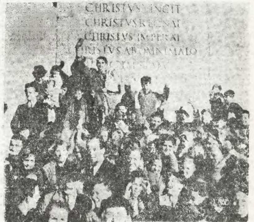
Tłumy wiernych manifestują przed Pałacem Watykańskim na cześć nowego Papieża.