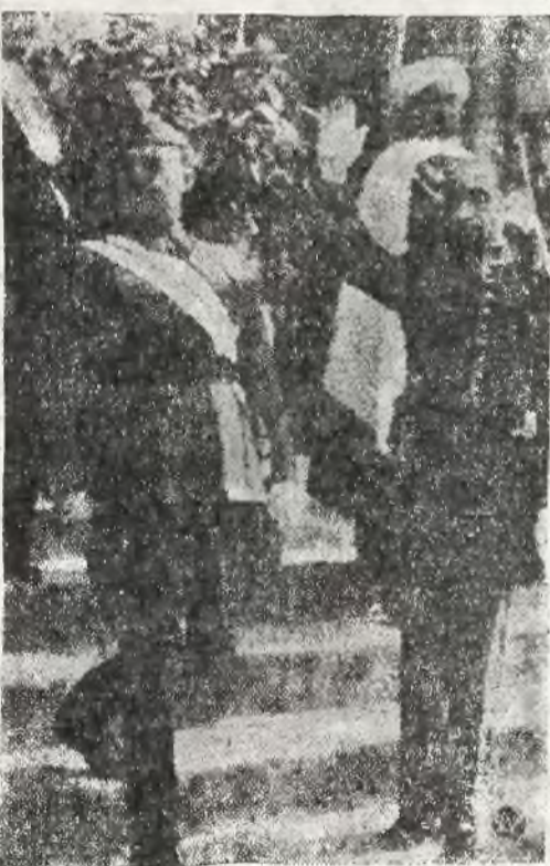
Gen. Franco witany owacyjnie w Burgos.