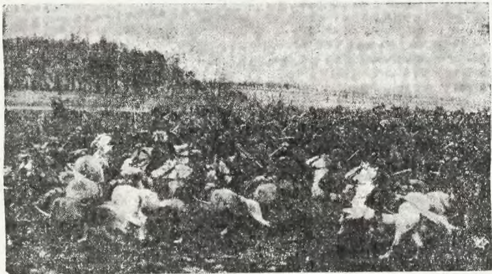
Szarża kawalerii polskiej

Nie o jej zniesienie więc można się spierać, lecz co najwyżej o jej unowocześnienie oraz o dostosowanie sposobów jej użycia do zmienionych warunków teraźniejszości i przyszłości.