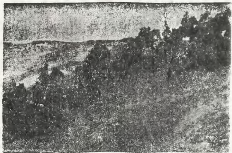
Forsowanie górzyszych terenów

„Tribuna” wreszcie przeciwstawiła przemówieniu Mussoliniego słowa prezydenta Roosevelta i uważa że prezydent Roosevelt niepotrzebnie występuje jako „międzynarodowy opiekun moralności”.