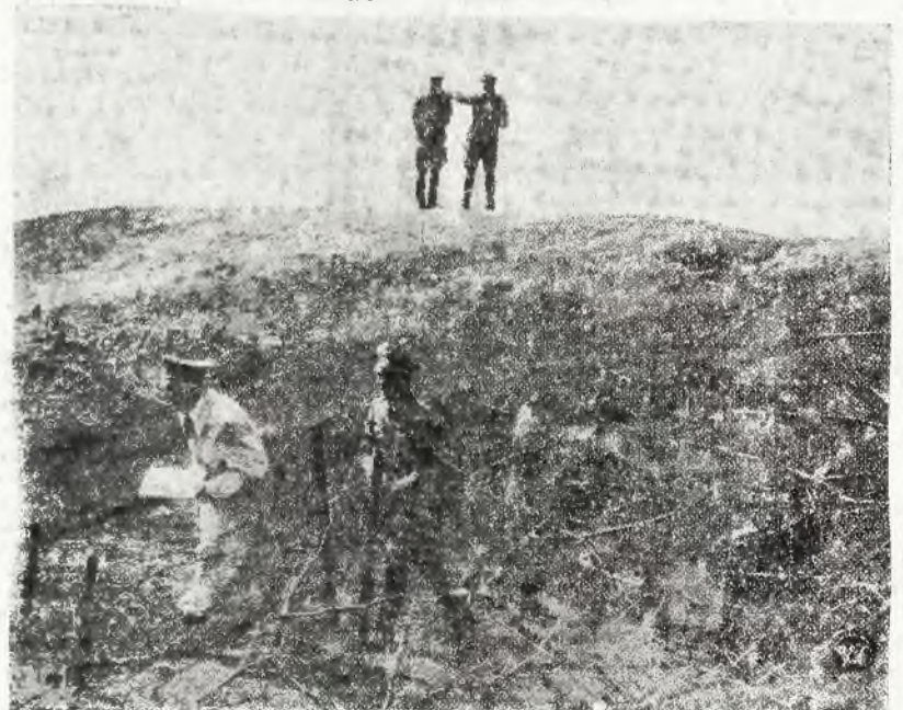
Kanclerz Hitler bada umocnienia niemieckie na zachodniej granicy Rzeszy.