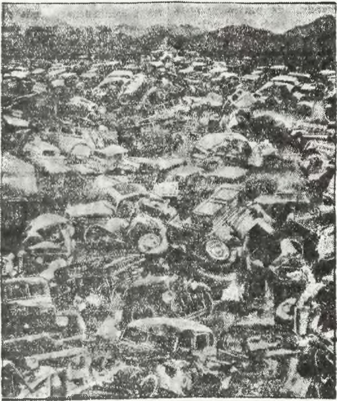
W Ameryce Północnej istnieją specjalne cmentarzyska samochodów, gdzie automobiliści umieszczają swe stare, nie nadające się już do użytku wozy.