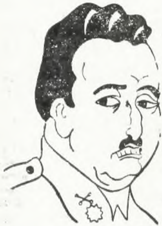
Gen. Franco w karykaturze

RZYM, 16. 5. „Popolo d'Italia“ zamieszcza wywiad swego współpracownika z gen. Franco. Na wstępie gen. Franco oświadczył, że w dziedzinie wojskowej, morskiej i powietrznej Hiszpania prowadzi będzie politykę, odpowiadającą możliwościom ekonomicznym kraju, uwzględniając gwarancje integralności terytorium narodowego.