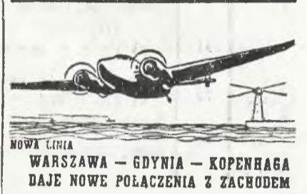
NOWA LINIA WARSZAWA — GDYNIA — KOPENHAGA DAJE NOWE POŁĄCZENIA Z ZACHODEM

Na tym dalszy ciąg obrad odroczono do środy 24 b. m.