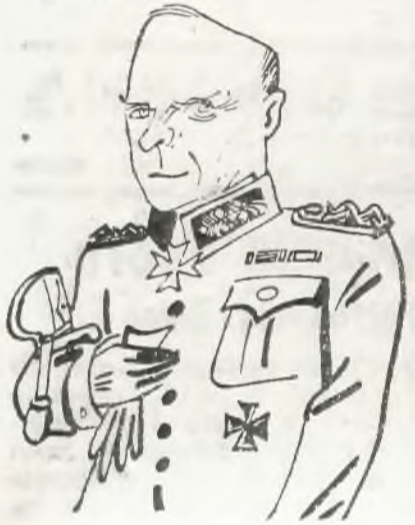
Gen. v. Brauchitsch

BERLIN, 25. 5. W ciągu ostatnich dni odbyło się w Berlinie szereg odpraw wyższego kierownictwa partyjnego, na których przywódcy narodo- socjalistyczni wypowiadali referaty obrazujące zadania poszczególnych oddziałów na wypadek wojny. Jednym z najważniejszych była od-