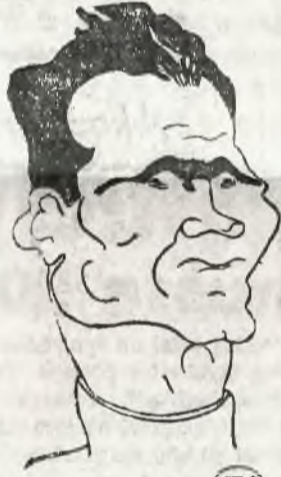
Kierownik partii Hess

Gestapo — mówił dalej Himmler — przeznaczony jest na czwarty front do zorganizowania akcji przeciw opozycji wewnątrz