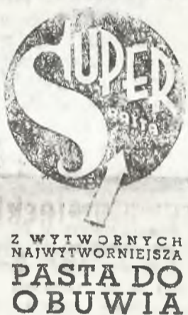
Z WYTWORNYCH NAJWYTWORNIJSZA PASTA DO OBUWIA

Wojna gospodarcza pomiędzy Anglią i Francją a Japonią — może być zarzewiem nowej „burzy nad Azją”.