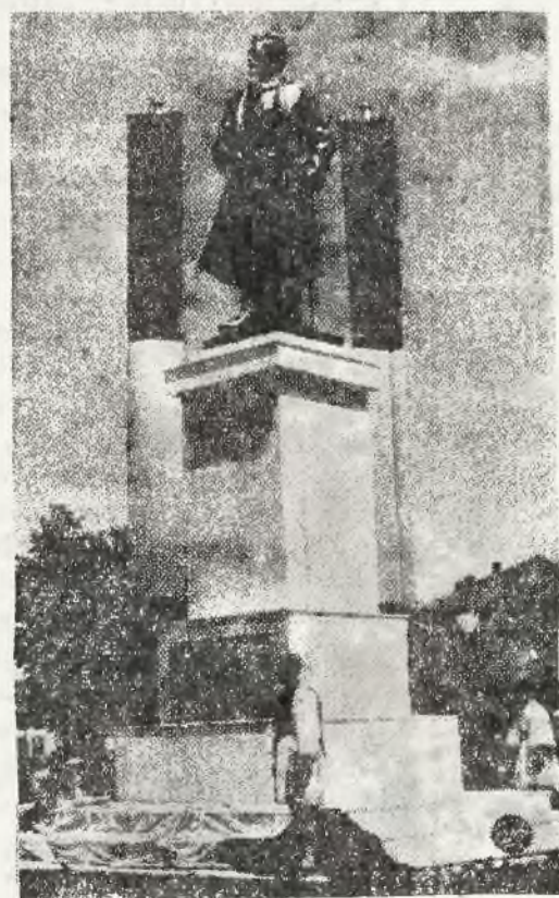
Pomnik króla Rumunii Ferdynanda I

Dardanelach. Zamówienia te początkowo otrzymały firmy niemieckie. Obecnie znów Turcja dokonała poważnych zamówień, na warunkach kredytowych, w Wielkiej Brytanii, w dziale komunikacyjnym. Mianowicie Anglia wykona i dostarczy Turcji kilkadziesiąt parowozów, oraz kilkadziesiąt wagonów towarowych.