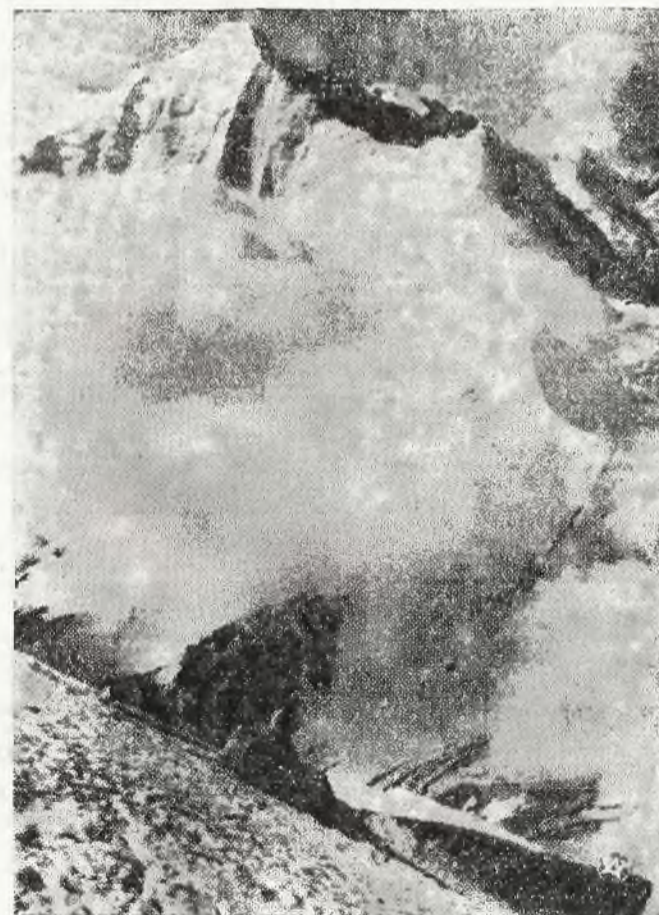
Widok ze śnieżnej, środkowej części południowej grani Nanda Devi East (7430 m.), zdobytego w dniu 2 lipca b. r. przez polską wyprawę himalajską

REDAKCJA: Warszawa Al Jerozolimskie 121 Telefony 666-62 (sekretariat 666-99 (ogólny)) ADMINISTRACJA: Warszawa, Marszałkowska 74 — Zarząd i Duchaletaria tel 9-24-61 — Dział ogłoszeń tel 9-24-78 — Prenumerata tel 9-09-93 — Konto rozrachun kowe Nr 3 Konto P K O Nr 23.400 Skrytka Pocztowa 145 Adres telegraficzny: ABC Warszawa Oddział Praski Administracji Białostocka 20 tel 10050 czynny godz 1-20 PRZEDSTAWICIELSTWA: Łódź Piotrkowska 92 tel 278-48 Biuro czynne w godz 9-19 Poznań 27 Grudnia 2, Włocławek — Cyganki 34, tel 135, Kalsz, Rzeźnicza 4, tel 477, Katowice — ul Starowiejska 3 PRENUMERATA miesięczna 12 odniesieniem do domu i na orawitacji 3 30 miesięcznie; wydanie B wraz z premią 2 30 miesięcznie. Za granicą 2 400 Wyd B (z premią książkową) 5 50 Za zwrot nadesłanych a nie zamówionych rekopisów redakcja nie odpowiada