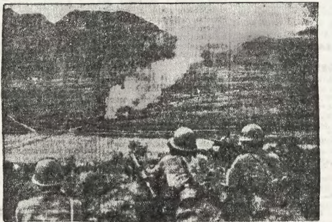
Oddziały japońskie obserwują skutki bombardowania przez lotników chińskich pojeży