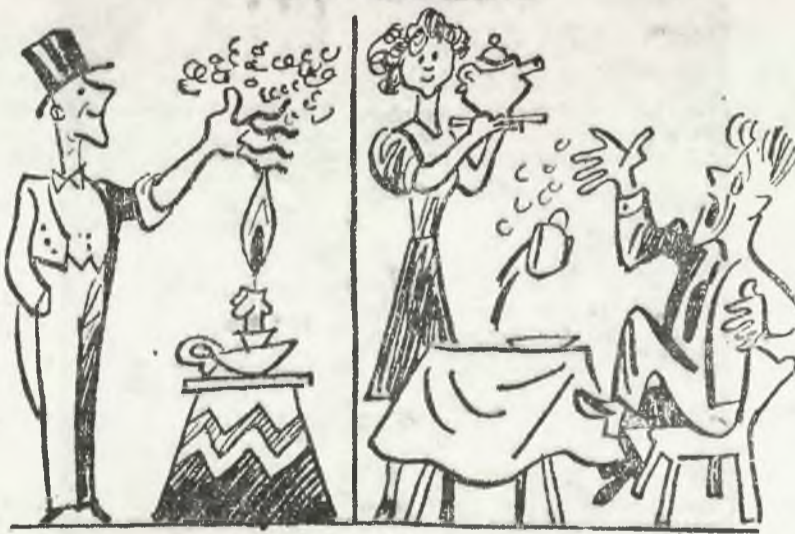
Na scenie — i w domu.