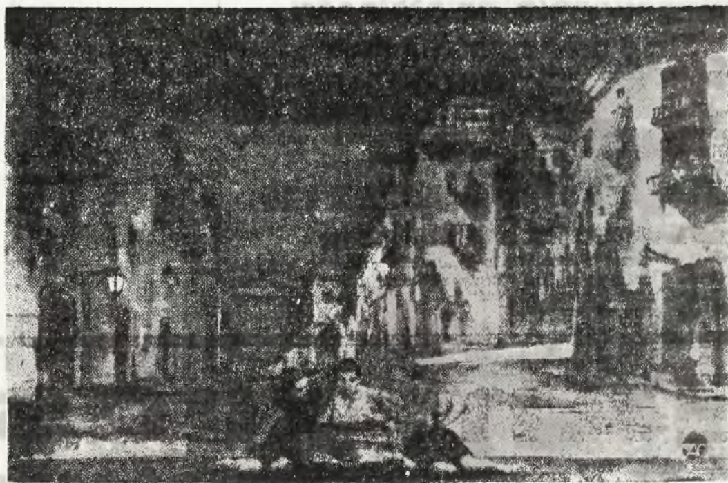
Scena z aktu I-go: Zaulek w Genul.