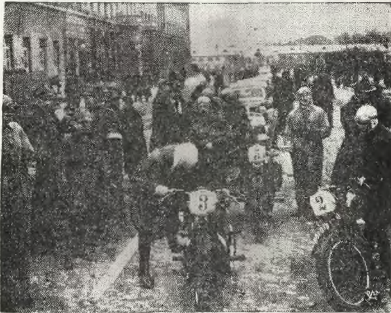
W Warszawie odbyła się impreza motocyklowa, pod nazwą „Pogoń za czołgiem”, zorganizowana przez sekcję motocyklową Legii. Na zdjęciu fragment startu motocyklowego w pogoni za czołgiem.