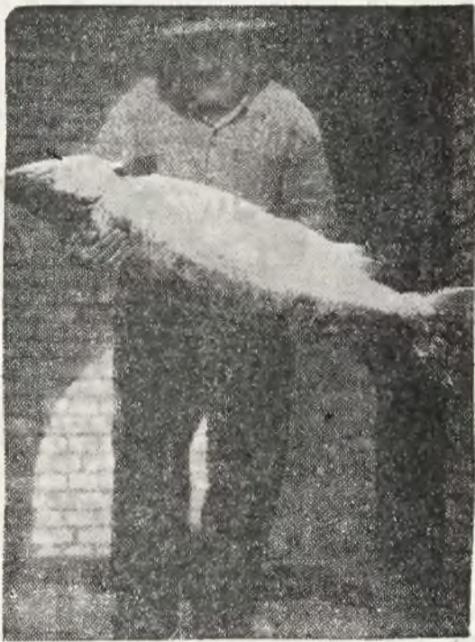
Wiosenne połowy łososi już się rozpoczęły. Oto wspaniały okaz „króla” Bałtyku, o wadze 35 kg. i długości 1 m. 45 cm.