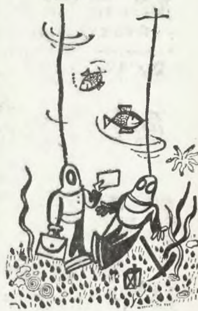
— Panie, oto wezwanie dyrektora skarbu o zapłacenie podatków.