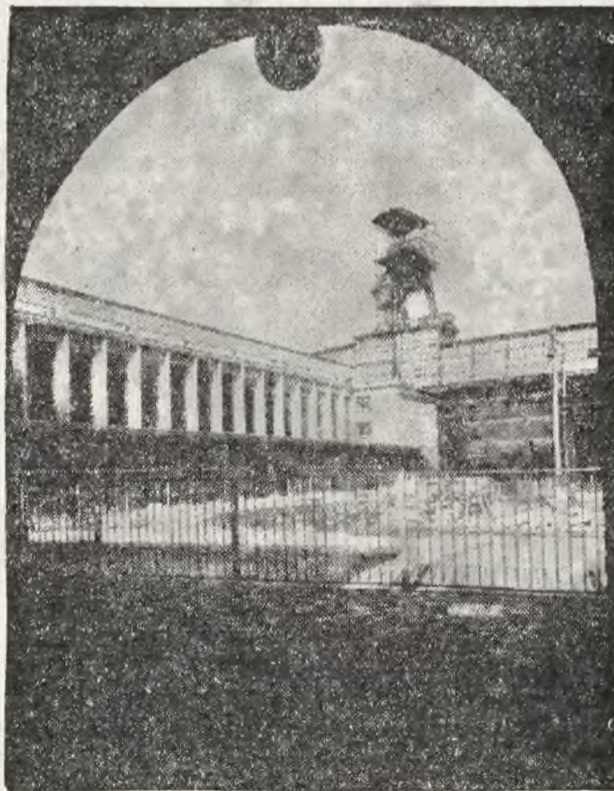
W Nowym Bytomiu odbyła się uroczystość poświęcenia nowych urządzeń na kopalni „Wanda - Lech”. Na zdjęciu rzut oka na zmodernizowaną kopalnię.