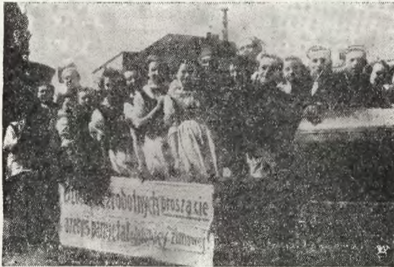
Fragment złożeń w Katowicach na dar Śląska dla dzieci bezrobotnych.