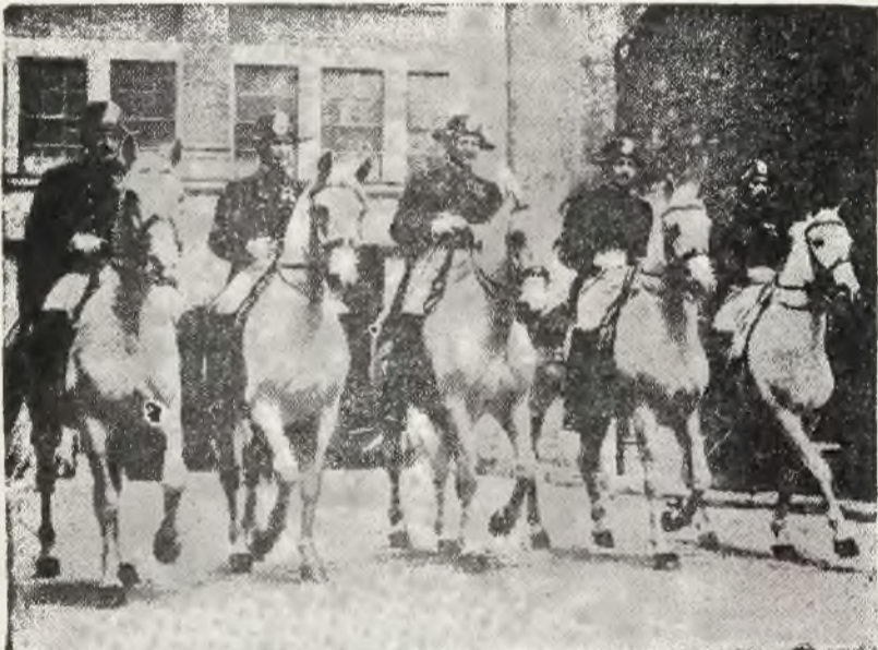
Śłynna na całym świecie starohiszpańska szkoła jeździecka w Wiedniu zostanie w najbliższym czasie przeniesiona do Berlina.