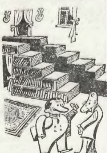
Schody jako biblioteka.