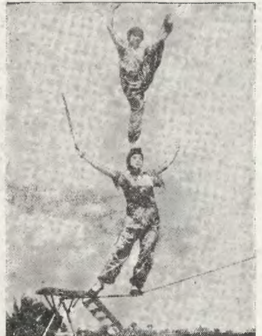
Chińskie ewolucje akrobacyjne w jednym z cyrków amerykańskich