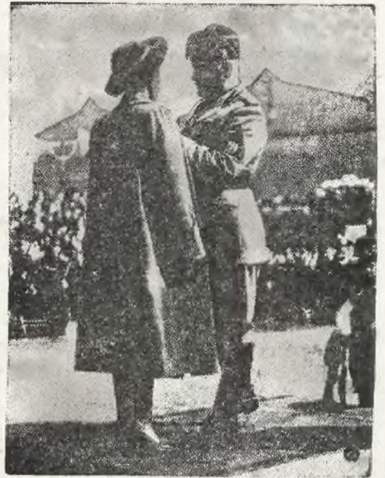
Z okazji rocznicy powstania wojskowego lotnictwa włoskiego szef rządu, Mussolini, udekorował złotymi Medalami Zasługi matki lub wdowy po 83-ch lotnikach, poległych w Abisynii.