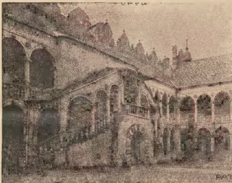
W Baranowie, w powiecie tarnobrzesckim, znajduje się pałac, należący do najpiękniejszych budowli polskiego renesansu. Zbudowany przez Andrzeja Leszczyńskiego, stanowi prawdziwy klejnot architektury renesansowej w Polsce. — Zdjęcie nasze przedstawia podwórzec Zamku Baranowskiego.