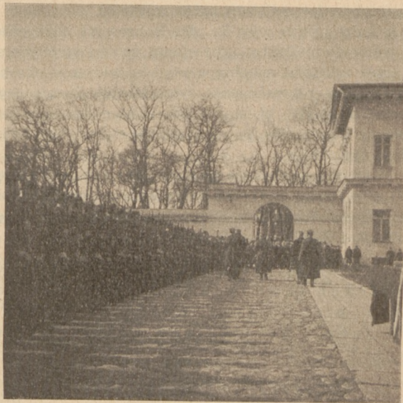
Raport kompanii honorowej.

Solenizantowi Marszałkowi Edwardowi Śmigłemu-Rydzowi dostąpi niebawem zaszczytu ujrzenia Go, na własne oczy i bezpośredniego zamanifestowania swych uczuć dla Wodza Narodu.