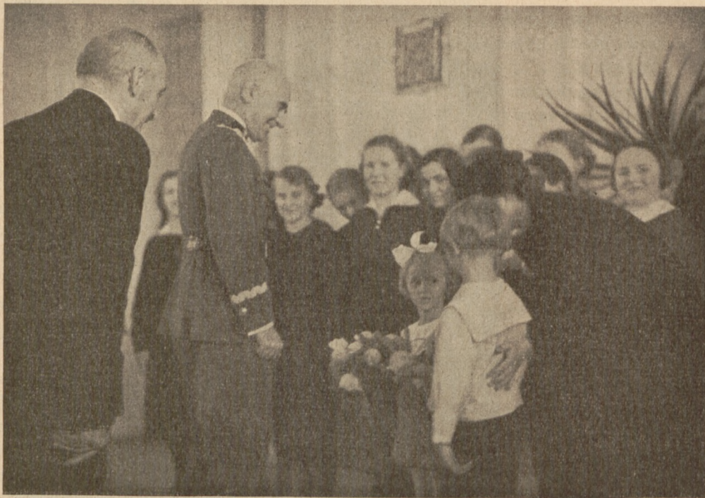
Delegacja młodzieży szkolnej składa Naczelnemu Wodzowi w dniu Jego Imienin życzenia w sali recepcyjnej Pałacu Reprezentacyjnego w Wilnie.

Tak, Panie Marszałku, ożywią ją oni rytmem bujnej, młodej krwi, oni wychowywani w murach Miasta, w którym od Serca płynie płomienna mowa Ideału.