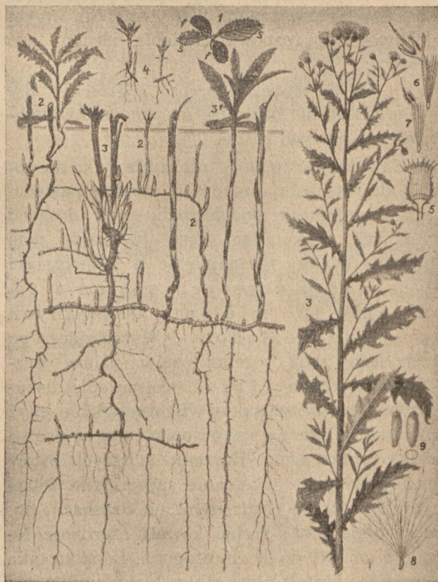
Oset polny Cirsium arvense (L.) Scop.

nych głębokościach rozchodzą się poziome rozłogi (patrz rysunek), z których wyrastają nowe rośliny, nawet na znacznej odległości od krzaka macierzystego tego chwastu i w ten sposób coraz dalej rozrasta się. Korzenie ostu sięgają nieraz do 2 metrów głębokości. Łodygi okrągłe lub zlekka kanciaste, owłosione w dolnej części, mają liście ząbzione, podłużno-lancetowate, kolczaste. Kwiaty, zebrane w koszyczki kwiatowe, o barwie jasno-purpurowej, lub różowo-liliowej i wyjątkowo białej. Kwitnie od czerwca do sierpnia na łąkach i dojrzewa mniej więcej równocześnie z trawami i koniczyną, a na polach — z innymi roślinami uprawnymi. Nasiona drobne, zaopatrzone są w długie, później opadające, białawe, piórkowate włoski, służące do ich rozsiewania przy pomocy wiatru. Jedna roślina wydaje przeciętnie 4500 nasion, chociaż liczba ich może sięgać i do 40000. Waga 1000 nasion wynosi około 1 grama*).