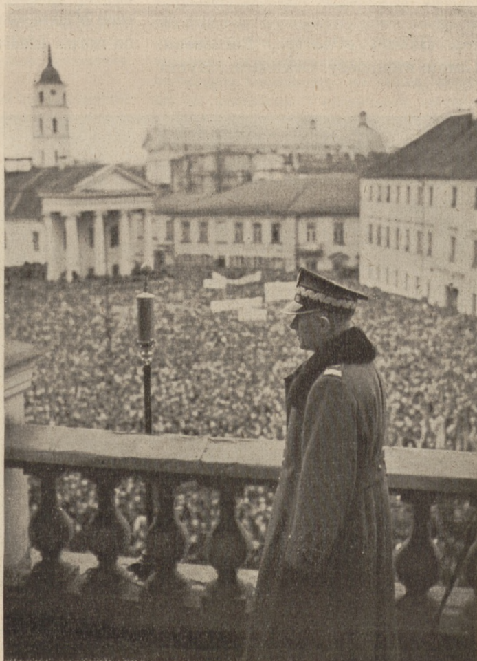
Pan Marszałek Edward Śmigły Rydz na balkonie Pałacu Reprezentacyjnego w Wilnie dnia 18 marca r. b.