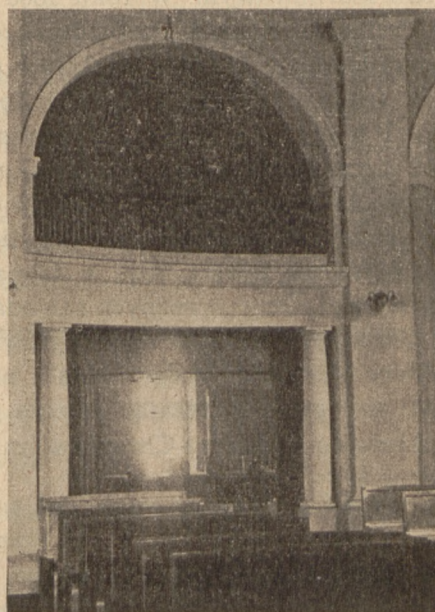
Fragment d. sali wykładowej J. Śniadeckiego (obecnie sala posiedzeń Kuratorium).