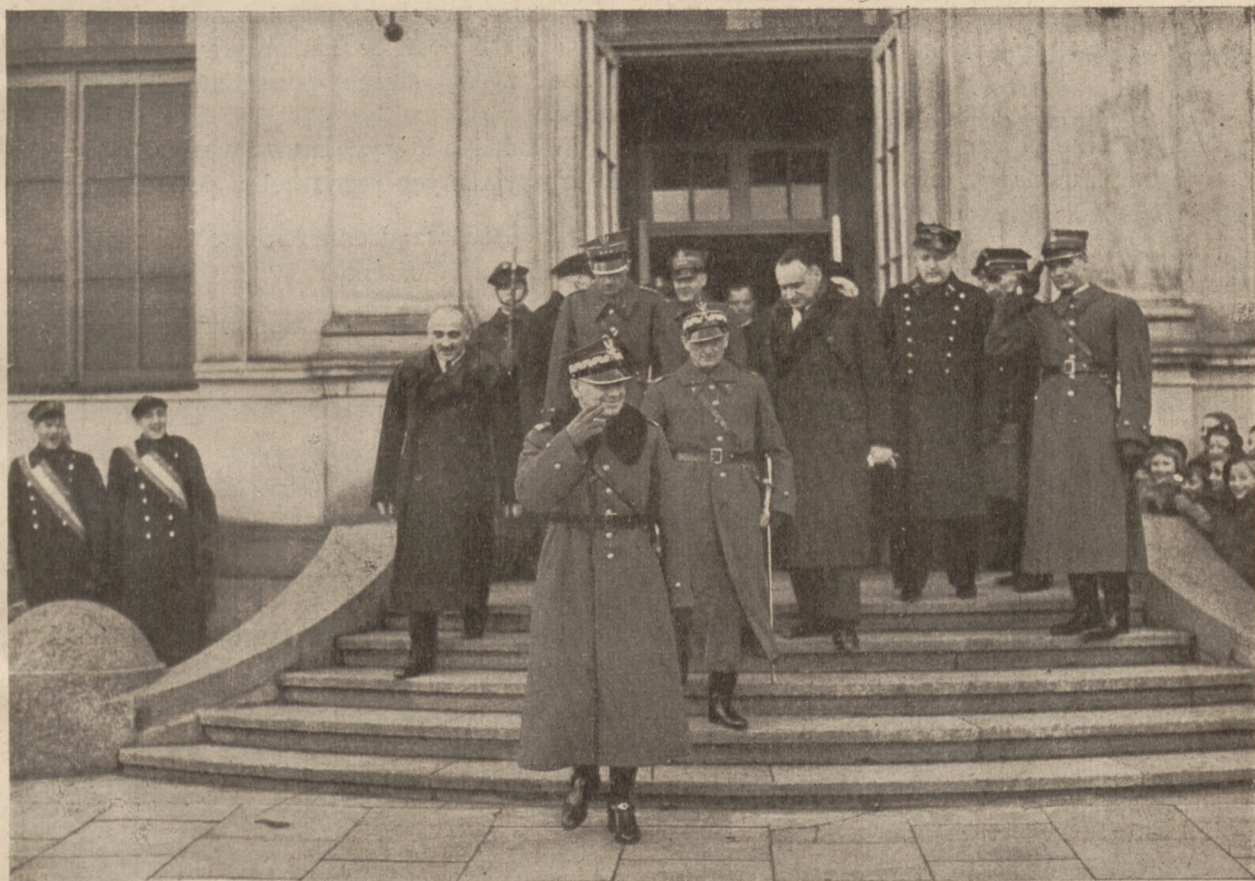
Przyjazd Pana Marszałka Edwarda Śmigłego-Rydza do Wilna dnia 18 marca r. b.