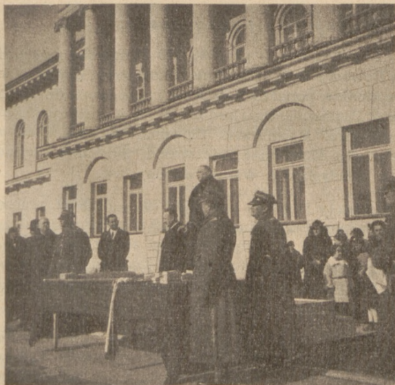
Przemówienie Pana Kuratora O. S. Wil.

Pan Kurator zaznaczył na wstępie, że uroczystość rozdania nagród strzeleckich odbywa się w osobliwych warunkach, kiedy wojsko polskie stoi w pogotowiu bojowym na granicy Państwa i młodzież ofiarowując płonny swych osiągnięć strzeleckich w darze Dostojnemu