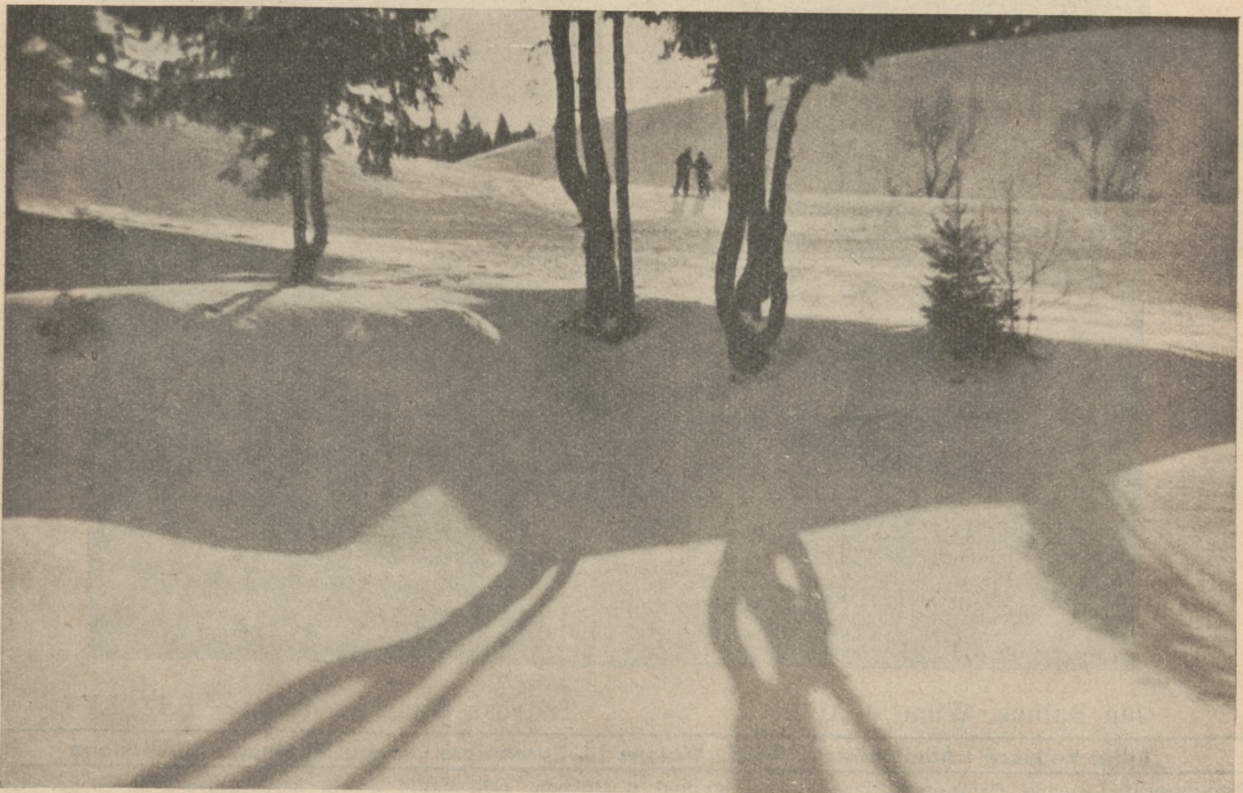
I. Drzewiecki — Wilno

Dla zainteresowanych podajemy adres administracji, która na żądanie wysyła numery okazowe: Wilno, Bonifraterska 2-4. Przedpłata „Przeglądu Fotograficznego” wynosi rocznie 6 zł.