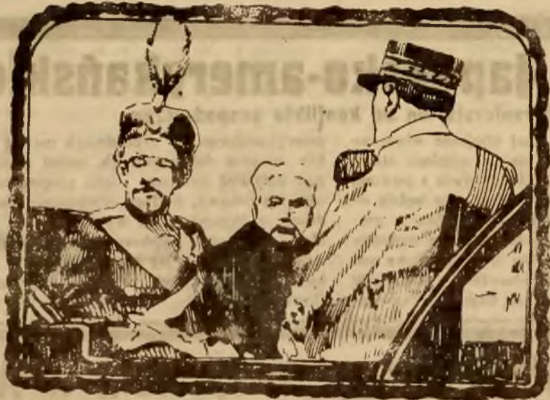
Król, Prezydent Millerand, gen. Berthelot.