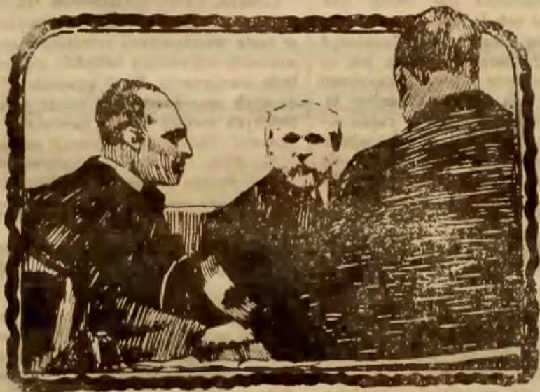
Duca, rumuński min. spr. zagran., premier Poincaré.