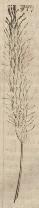
Lisi ogon. Fig. 1