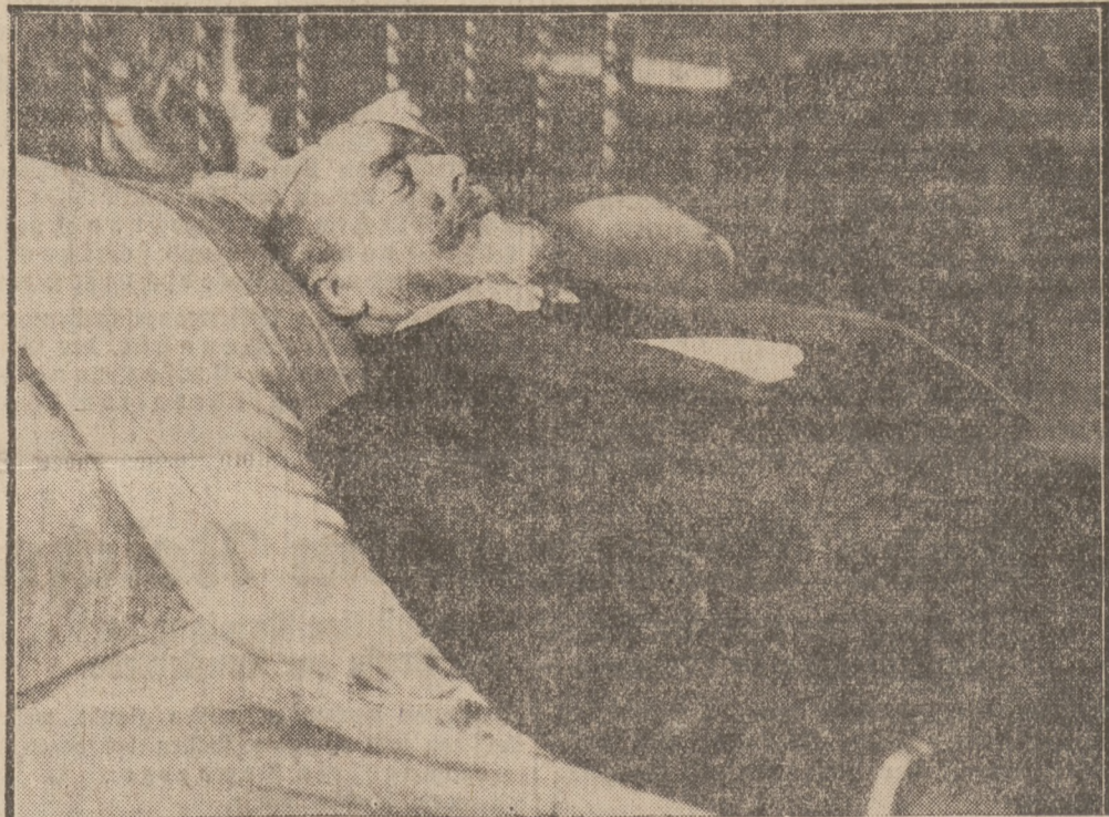
Der französische Staatspräsident Doumer auf dem Totenbett

Paris. Durch einen Zufall ist der Mordanschlag auf den Präsidenten Frankreichs im Tonfilm verewigt worden. Eine deutsche Filmfirma hatte in das Palais National einen Operateur geschickt, der den Besuch des Präsidenten in der dort stattfindenden Buchausstellung aufnehmen sollte. Auf diese Weise kam der Mord in den Film, der bekanntlich während dieses Besuches geschah. Diese einzigartige Aufnahme wurde am nächsten Tag durch einen Flieger unter Polizeiaufsicht nach Berlin befördert.