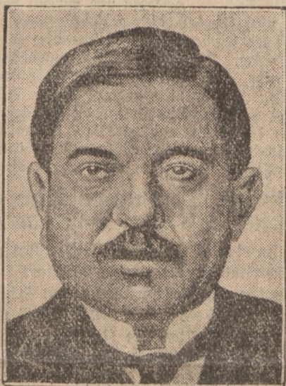
Chef der neuen französischen Regierung wurde Senator Pierre Laval.

Handelsministerium: Rollin. Handelsmarineministerium: de Chappedelaine. Landwirtschaftsministerium: Tardieu.