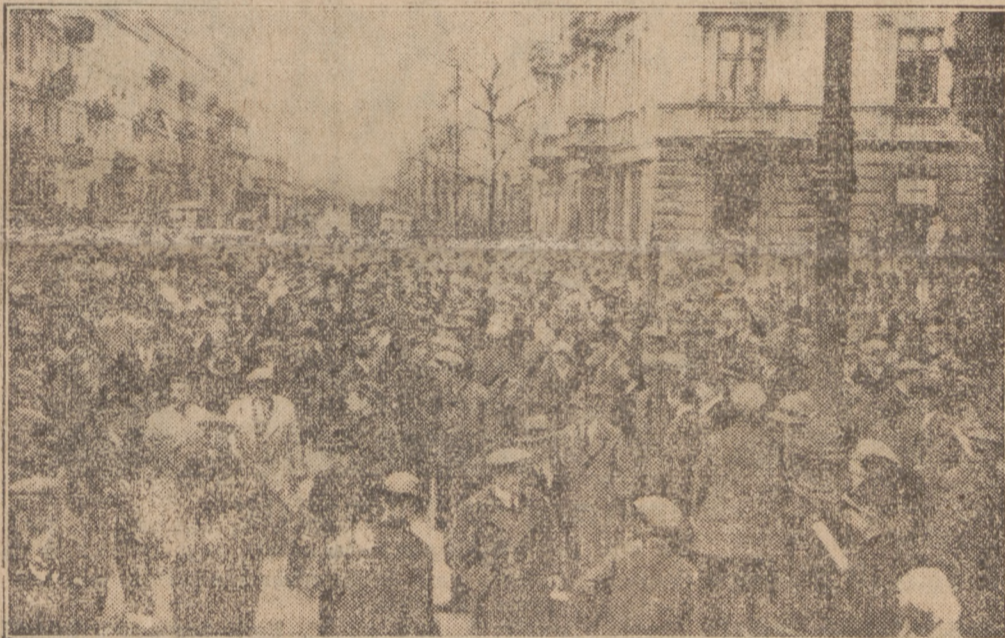
Warschauer Demonstrationen wegen Danzig

Sofia. Der König hat den Führer der Demokraten, Malinoff, erneut mit der Kabinettsbildung beauftragt. Dieser erklärte Vertretern der Presse, er werde sich bemühen, den Auftrag entsprechend den Richtlinien des Königs auszuführen. Er beabsichtige unverzüglich die Fühlung mit dem Führer der demokratischen Arbeitsgemeinschaft Liapischew aufzunehmen und hoffe bestimmt, daß die Besprechungen jetzt zur Bildung eines neuen Kabinetts führen werden.