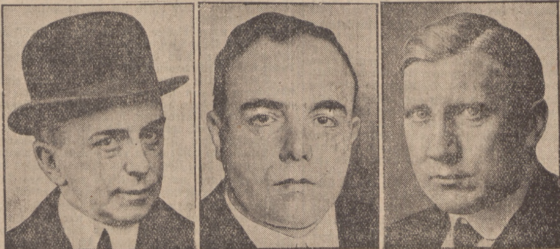
Die Fachberater der deutschen Minister für die Konferenzen in Paris und London. Links: Dr. Leopold von Hoesch, der deutsche Botschafter in Paris, der den Besuch der deutschen Minister vorbereitete. — Mitte: Staatssekretär Dr. Hans Schäffer (Reichsfinanzministerium). — Rechts: Staatssekretär Dr. v. Bülow (Auswärtiges Amt), werden Reichskanzler Dr. Brüning und Reichsaußenminister Dr. Curtius nach Paris und London als Fachberater begleiten.

Sehr wertvoll sind dagegen die Resultate biologisch-historischer Untersuchungen. Sie zeigen, daß überall die Lokalgeschichte, biologisch betrachtet, den Hauptteil rassengeographischer Erklärungen liefert, besonders dann, wenn sie durch genealogisch-bevölkerungsbiologische Forschungen unterbaut werden kann. Schon die erste Untersuchung dieser Art (Ebinel-Finkenwälder) hat z. B. gezeigt, daß die innere Umschichtung der Bevölkerung durch Einwanderung und Auslese (also auch ohne wesentliche Zu- und Abwanderungen) schon in einem bzw. einigen Jahrhunderten zu einer völligen Veränderung der rassischen Beschaffenheit führen kann. Damit ist die Wirksamkeit selektiver Zuchteinflüsse auf den Men-