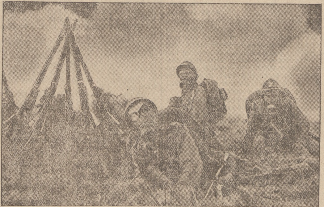
Das ist das Gesicht des Krieges der Zukunft

Warschau. Das von der Regierung gebildete Komitee zum Kampf gegen die Arbeitslosigkeit ist am Mittwoch in Warschau durch die Berufung eines Präsidiums in Aktion getreten. In das Präsidium sind der frühere Finanzminister Klarner, der ehemalige Vizearbeitsminister Jurkiewicz und Senator Zwanowski aus dem Regierungslager berufen worden. Ueber die zu unternehmenden Schritte des Komitees verlautet nichts weiter.