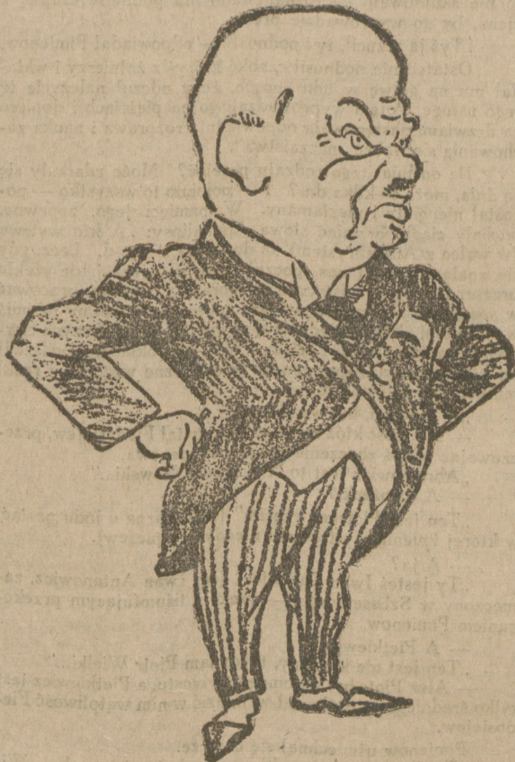
Stresemann, niemiecki minister spraw zagranicznych.