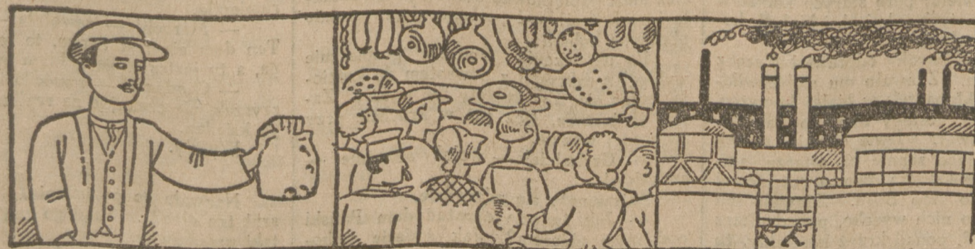
Fabryki idą całą siłą pary!