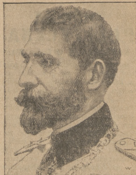
Król rumuński Ferdynand ciężko zachorował

Komisja wojewódzka do badania kosztów utrzymania stwierdziła, iż w Poznaniu ceny w listopadzie w stosunku do października wzrosły o 4,93 proc.