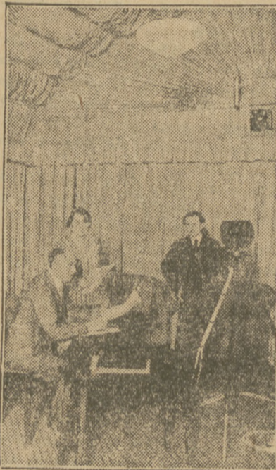
„Studio”, lokal, w którym odbywają się wykłady, koncerty i inne produkcje rozsyłane na cały kraj.