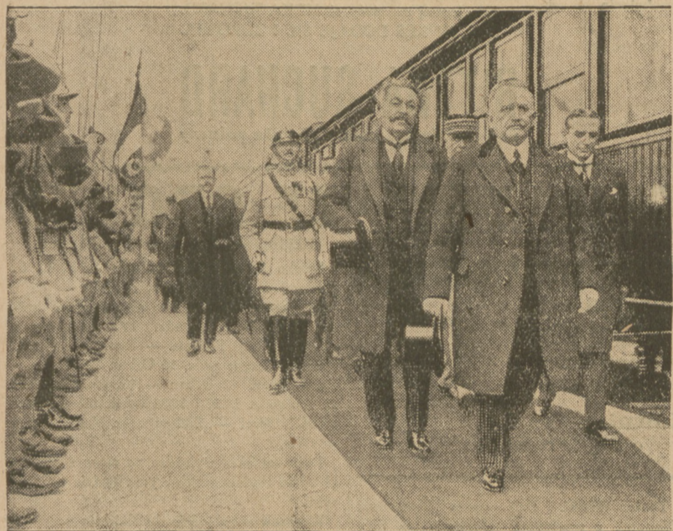
Na pierwszym zdjęciu widzimy prez. Doumergue'a i Brianda wysiadających z pociągu w Calais, skąd statkiem „Invieta” odjechali do Anglii. Drugie zdjęcie przedstawia prez. Doumergue'a i Brianda wysiadających z pociągu w Londynie, w którym znajdują się Król angielski, jego dwaj synowie oraz prezydent Francji.

Przy słabym trawieniu, małokrwistości, wychudnięciu, blednicy, chorobach gruczołów, wysypkach skórnych i czyrakach, reguluje naturalna woda gorzka „Franciszka Józefa” tak ważną obecnie działalność kiszki. Znakomici lekarze specjaliści przekonali się, że najwłaściwsze dzieci dobrze znoszą wodę Franciszka Józefa. 683