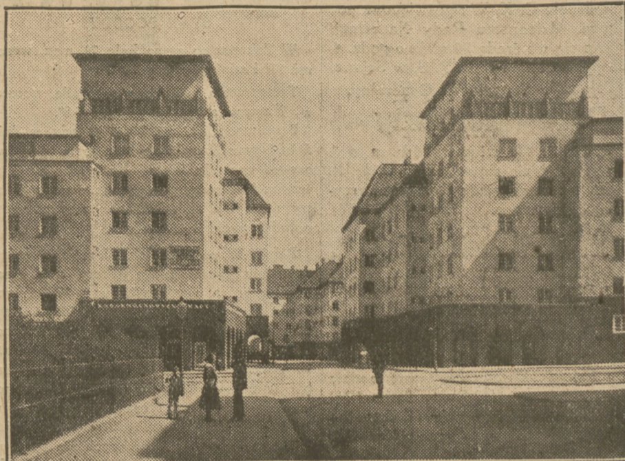
Wspaniały dziedziniec z tarasami i ogrodami dla dzieci w miejskim domu mieszkalnym dla robotników w XII dzielnicy Wiednia, wybudowanym przez Socjalistyczny Magistrat.