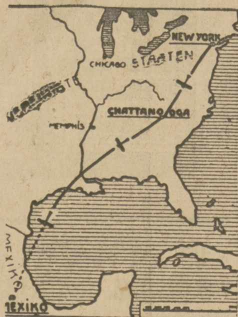
MAPA LOTU LINDBERGH

Sławny zdobywca oceanu, lotnik Lindbergh dokonał ostatnio wspaniałego lotu z Nowego Jorku do Meksyku, gdzie był witany przez ca-