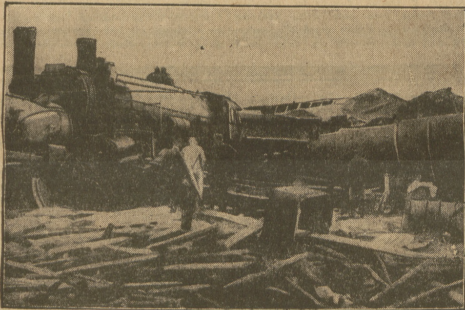
Pociąg pośpieszny na linii Praga — Budapeszt zderzył się z pociągiem towarowym, 23 osoby poniosły śmierć, około 100 osób zostało rannych.