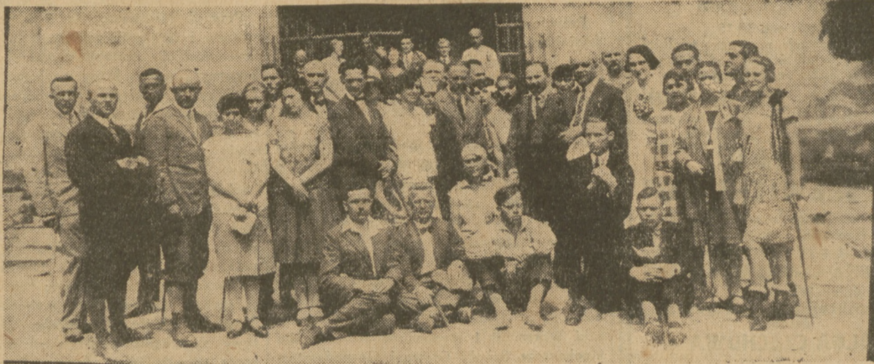
PRZED KOŚCIOŁEM W LEWOCZY