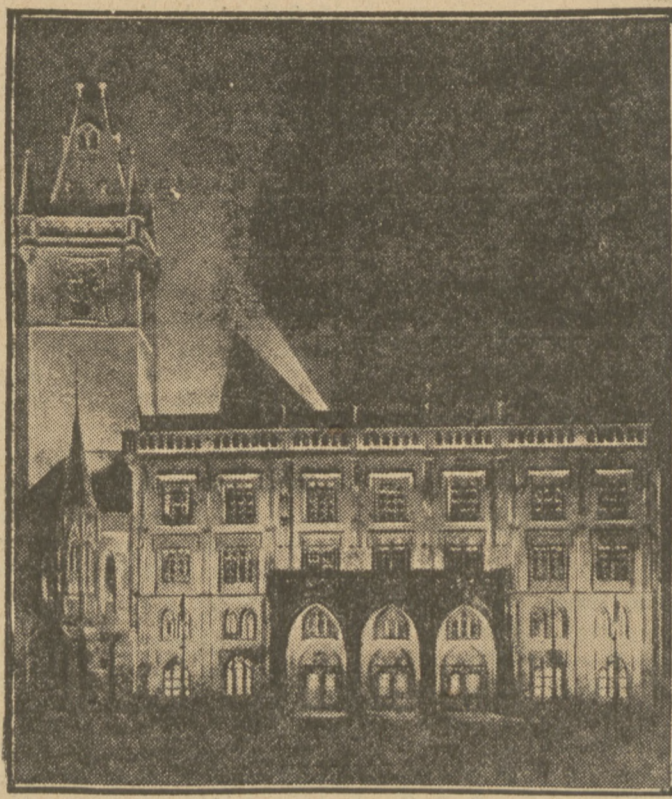
Illuminacja ratusza praskiego w dniu czeskiego święta narodowego.